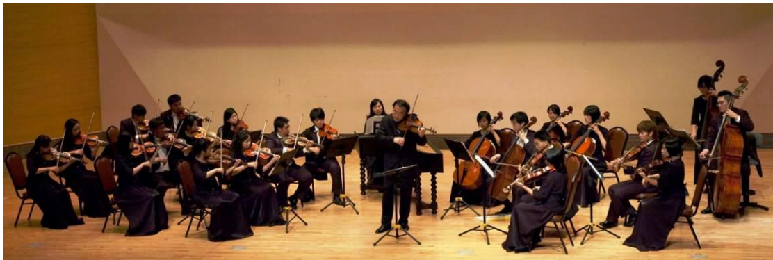
2009 年小提琴家林昭亮與巴洛克獨奏家樂團於台南大學雅音樓演出實況

2004 年國立中山大學音樂學系教授們鑒於國內鮮少演奏編制具有大鍵琴的古典音樂樂團，於是李美文教授凝聚系上專、兼任師資與傑出校友約二十人，弦樂為主、管樂為輔，自發性組成「巴洛克獨奏家樂團」，以推廣巴洛克時期與古典早期音樂為目標，透過這群音樂家的努力，將巴洛克時期精緻的音樂作品介紹給所有喜歡古典音樂的人們。樂團初期在南臺灣之音樂廳與校園巡迴演出，也有計畫的與國外相似樂團做演出交流。同年，首場音樂會於台南縣新營市舉辦，並於國立中山大學 24 週年的校慶音樂會上與臺北室內合唱團合作演出。自 2005 年起不定期邀請國內外知名的器樂獨奏家及聲樂家擔任客席演出，3 月首次全省巡迴演出，地點包括國立臺南大學雅音樓、高雄市音樂館、臺北新舞臺、台南縣南新國中音樂館演奏廳。