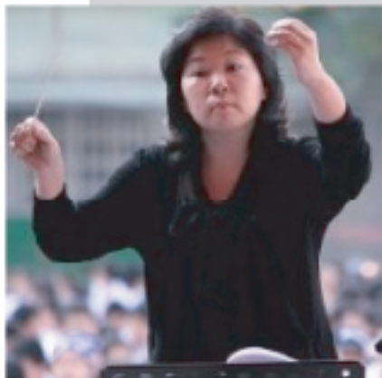
台灣合唱協會秘書長