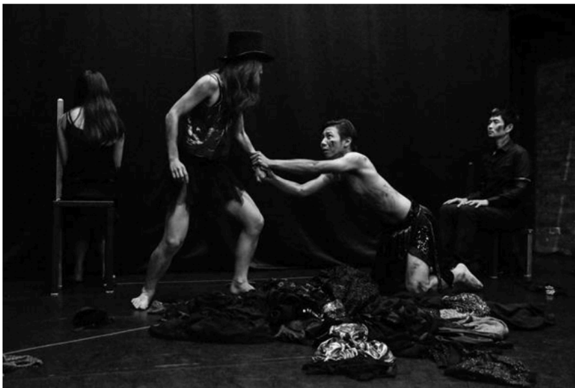
描述偷渡移民故事的〈請讓我進去〉。

為紀念諾貝爾文學作家貝克特110歲誕辰，盜火劇團推出《生存異境》劇展，集結劉天涯〈那邊的我們〉、何應權〈請讓我進去〉這兩部華文原創劇本，向貝克特致敬，今（28日）至5月1日台北牯嶺街小劇場演出。