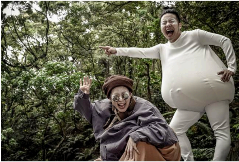
〈那邊的我們〉描述在一個的房間裡，有一對雙生兄妹不斷對話，妹妹會不斷長大並且變老，而哥哥則是永遠處於包著尿布的嬰兒狀態。

分享至Facebook 分享至Google+ 分享至Twitter 分享至Weibo