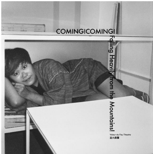
國立臺北藝術大學劇場創作藝術所表演組

2018 明日和和製作所 X 國家兩廳院 教育推廣活動《劇院魅影之不願讓你一個人》飾演 羅密歐 2017 關渡藝術節 《十二怒漢》飾演 8 號 2017 第十屆台北藝穗節 《四礫葛之男生宿舍》飾演 李坤 2016 國立臺北藝術大學戲劇學院冬季 公演 《在那遙遠的星球一粒沙》飾演 小飯 2016 北藝大戲劇系 101 級畢製《食物 升降機》飾演 賓 2015 第八屆台北藝穗節 《強風吹拂》飾演 木村亞當 2014 玄奘大學第一屆跨校聯合劇展 《蕭瑜潔》飾演 品豪 國立臺北藝術大學 劇場藝術創作研究所 期末呈現《無辜》、《放屁蟲》