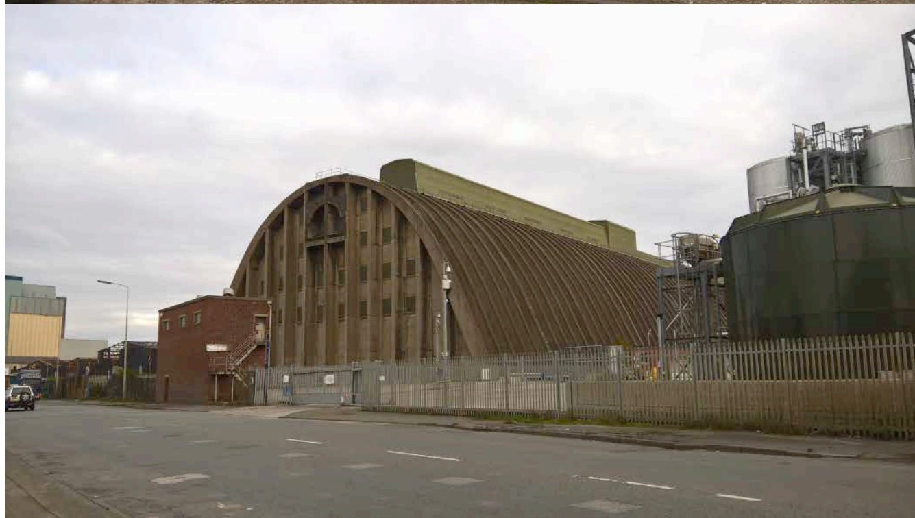
Tate & Lyle Sugar Silo, 2016, 數位影像, 依場地而定