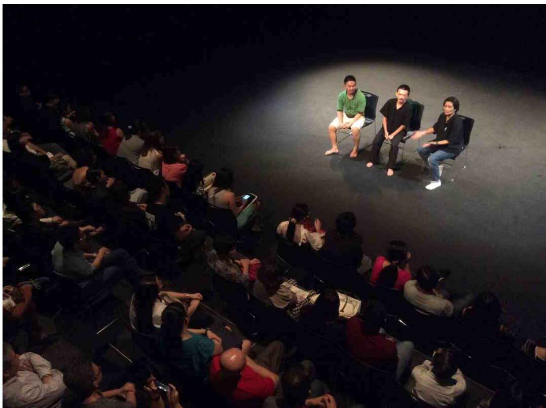
M1 華文小劇場藝術節講座「客廳裡的小聚會——劇場審查制度」座談