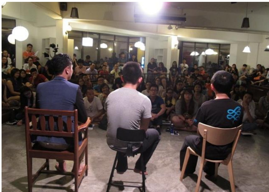
(6)馬來西亞·麻坡：中化中學，世紀大樓演出後交流