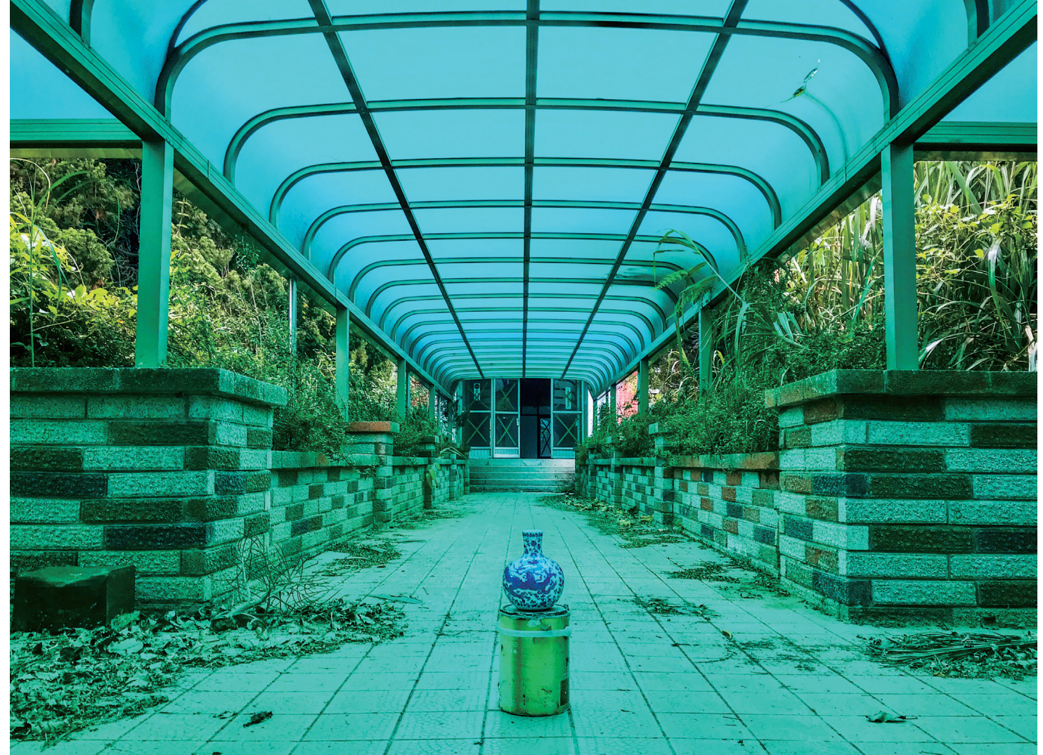
© Karolina Markiewicz & Pascal Piron, To not be Destroyed to Powder by the Powder and the Fist , film still, 2018