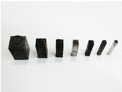
(左下) 鉛字號數，由左至右分別為初號、一號、二號、三號、四號、五號、六號