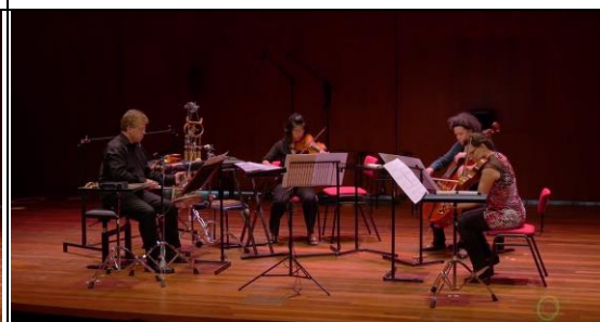
TivoliVredenburg Hertz 廳內部； 筆者作品 R[o/u]LE(s) 由 Bozzini Quartet 演出片段截取