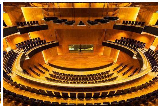
TivoliVredenburg Hertz 廳內部