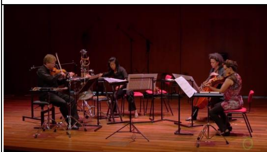
TivoliVredenburg Hertz 廳內部； 筆者作品 R[o/u]LE(s) 由 Bozzini Quartet 演出片段截取