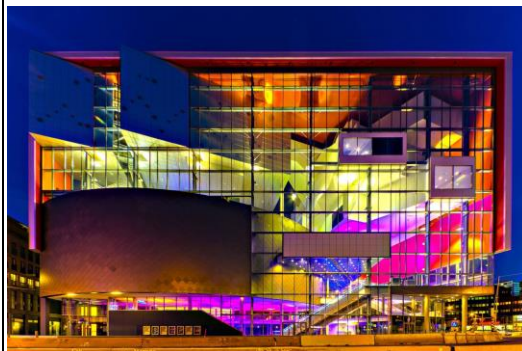
TivoliVredenburg 音樂中心外觀