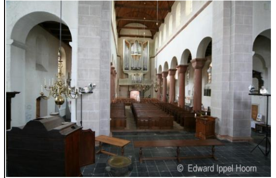
Pieterskerk 內部