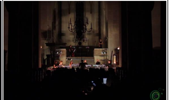
Pieterskerk 內部，筆者作品 Madhye II 由 Silbersee 演出片段截取