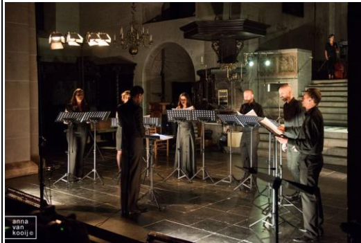
Pieterskerk 內部，筆者作品 Madhye II 由 Silbersee 演出片段截取