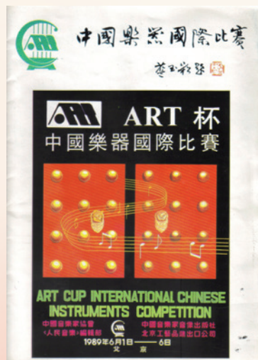
▲ART杯中國樂器國際比賽專刊封面

「ART杯中國樂器國際比賽」是文革結束後，在社會逐漸對外開放的氣氛下，大陸首次邀請海外選手參賽的國際性大型民樂賽事，由中國音樂家協會《人民音樂》雜誌主辦，於1989年6月1日至6日間在中央音樂學院音樂廳與演奏廳舉行。比賽共分琵琶、二胡、箏三項，每項下設少年組、青年組，每組再分業餘與專業兩類。藝術委員會主席是當時中國音協主席李煥之，評委會主任由吳祖強擔任，評審陣容囊括了當時海內外音樂界的大老，譬如，箏樂項目包括曹正、范上娥、項斯華及日本的三木稔等。臺灣的許常惠與王正平也名列其他項目的評審，但兩位或因當年五月以來天安門局勢不明而未赴北京出席賽務。