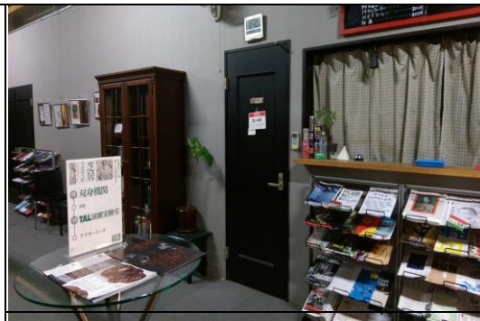
2 樓吧檯與文宣展示區