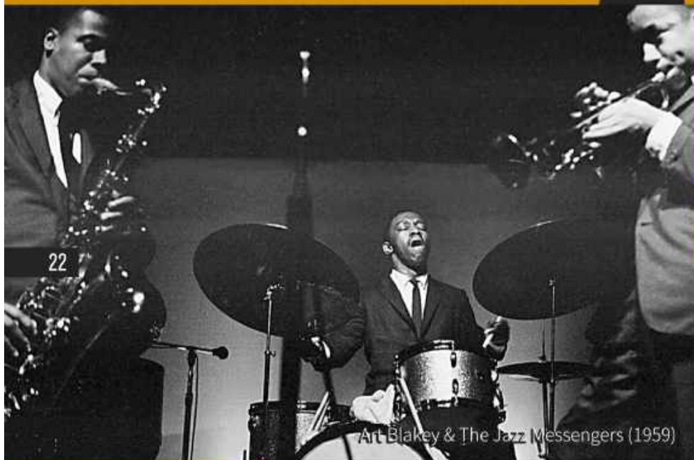
Art Blakey & The Jazz Messengers (1959)

歷經了一九四〇年代的咆哮革命，一九五〇年代的爵士樂終於獲得了暫時的休養生息。當時在美國西岸，由白人樂手領軍的酷派爵士 (Cool Jazz) 風靡一時；而位於美國東岸的黑人音樂家則開始反思，主張重新回到爵士樂的根基，以擺脫咆哮時代過度強調即興及炫技的思維。