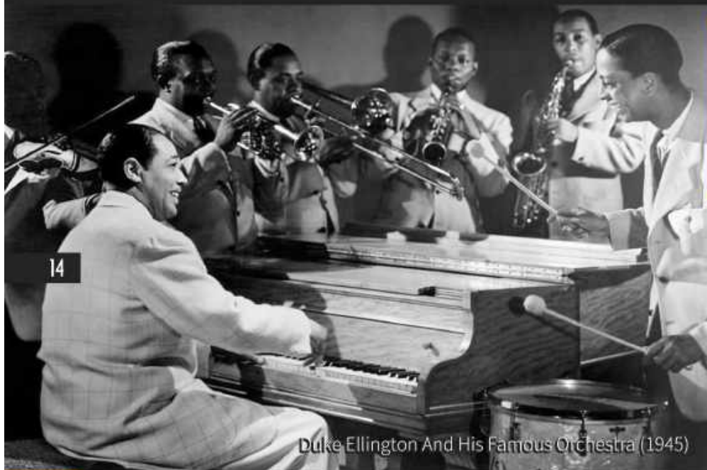
Duke Ellington And His Famous Orchestra (1945)

Jazz is The Trend: Music from Broadway & Swing Era