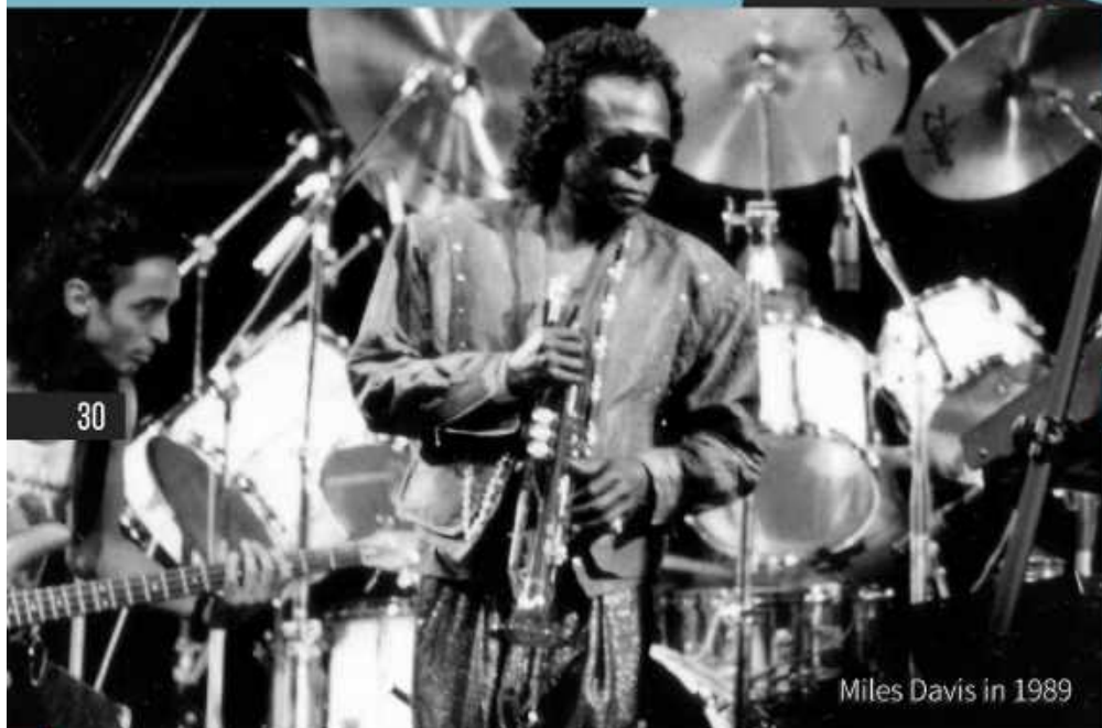
Miles Davis in 1989