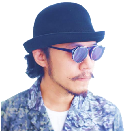
主視覺設計 | 方序中

影像設計作品 ：C Musical 製作音樂劇《最美的一天》《傳說對決 GCS 春季聯賽冠軍戰》開幕演出、瘋戲樂工作室 x 天作之合劇場《給我一個音樂執導!》C Musical 製作音樂劇《傾城記》《控肉遇見你》四喜坊劇集音樂劇《撲克臉》。