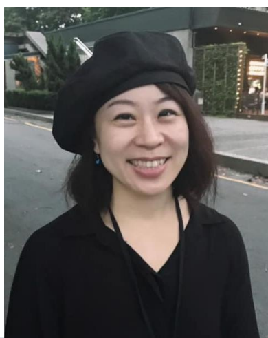
服裝造型設計 | 林俞伶

舞台設計作品 ：新古典舞團《曹丕與甄宓》《青春之歌》《沉默的杵音》果陀劇場《淡水小鎮-千禧年版》《開錯門中門》，國光劇團《大將春秋》復興國劇團《出埃及》《羅生門》《森林七矮人》屏風表演班《也無風也無雨》《未曾相識》朱宗慶打擊樂團音樂劇場《夢、風鈴》《狂響·狂想》等。