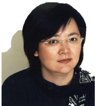
舞台設計 | 張維文

中央大學中文系畢業，美國印第安那大學戲劇研究所藝術創作碩士 ( Master of Fine Arts )。現任教於藝術學院劇場設計系、臺灣戲曲專科學校。2003 年為台灣贏得布拉格四年展國家館【特殊銀牌獎】；並曾應邀至巴西 Palacio das Artes 表演藝術中心擔任交換藝術家。2005 年獲選為 OISTAT 國際劇場組織總會副會長，2006 年-2012 年擔任 OISTAT 國際總部執行長，為 OISTAT 第一任亞裔執行長。