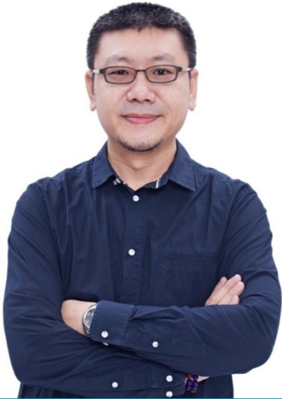
監製 | 林佳鋒