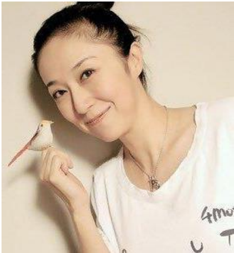
音樂設計 | 黃韻玲