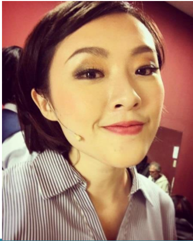
影像設計 | 鄭雅之