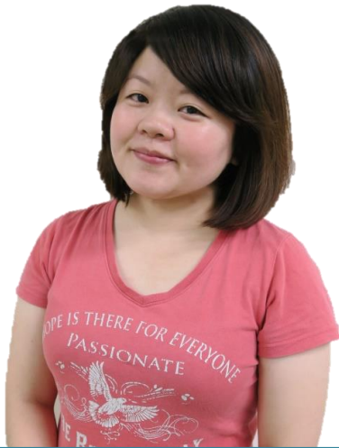
製作人 | 王宣琳