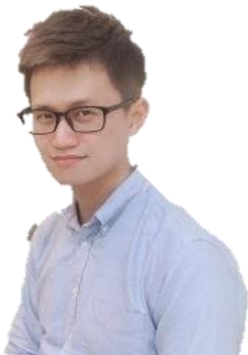
編劇 | 張敦智

影視作品 ：電影《秋天的藍調》《運轉手之戀》《牯嶺街少年殺人事件》電視劇《人生劇展-再見女兒》《命中注定我愛你》等。