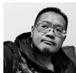
多媒體影像設計： 徐志銘

現為University of Oklahoma音樂藝術博士候選人。從台南到美國再回台南故鄉，埋在主修鋼琴的八年裡面，來去的日子裡接觸到故鄉的一群會反思且不隨波逐流的朋友，認知到音樂的渲染能力與舞者為彼此而存在一種前所未有的近距離，感覺到彼此的意識與呼吸，因此有新的詮釋角度。很開心能分享及呈現「舞」「樂」、視覺與聽覺，一來一往的悸動。