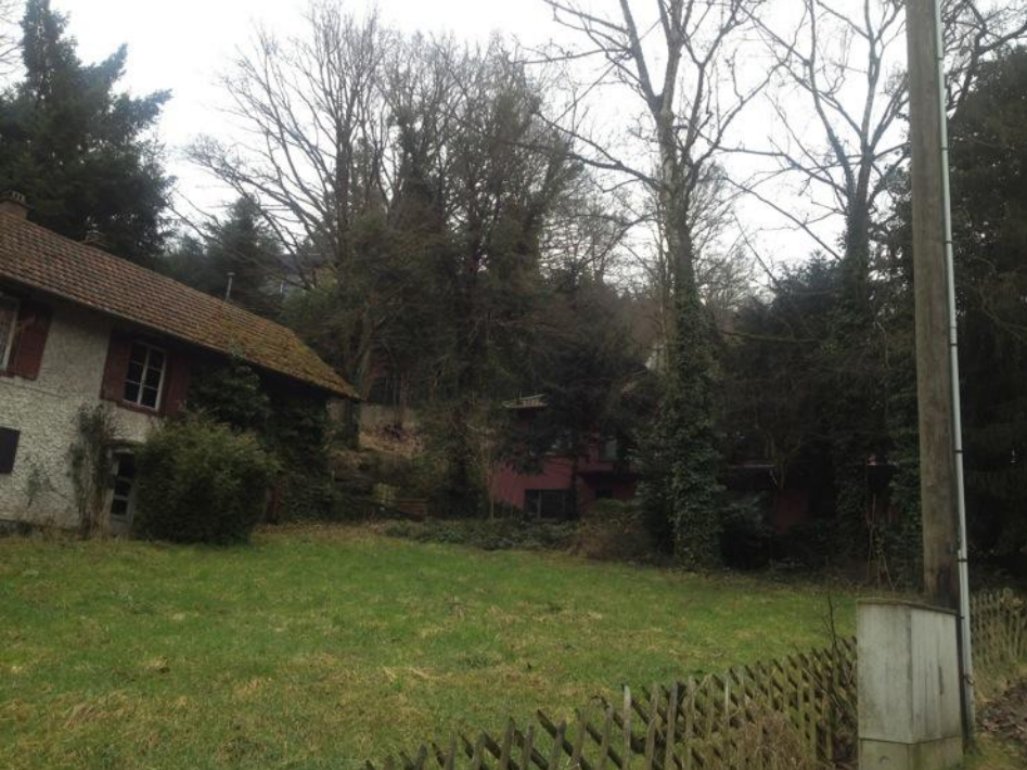
隱藏在樹林裡的粉紅屋