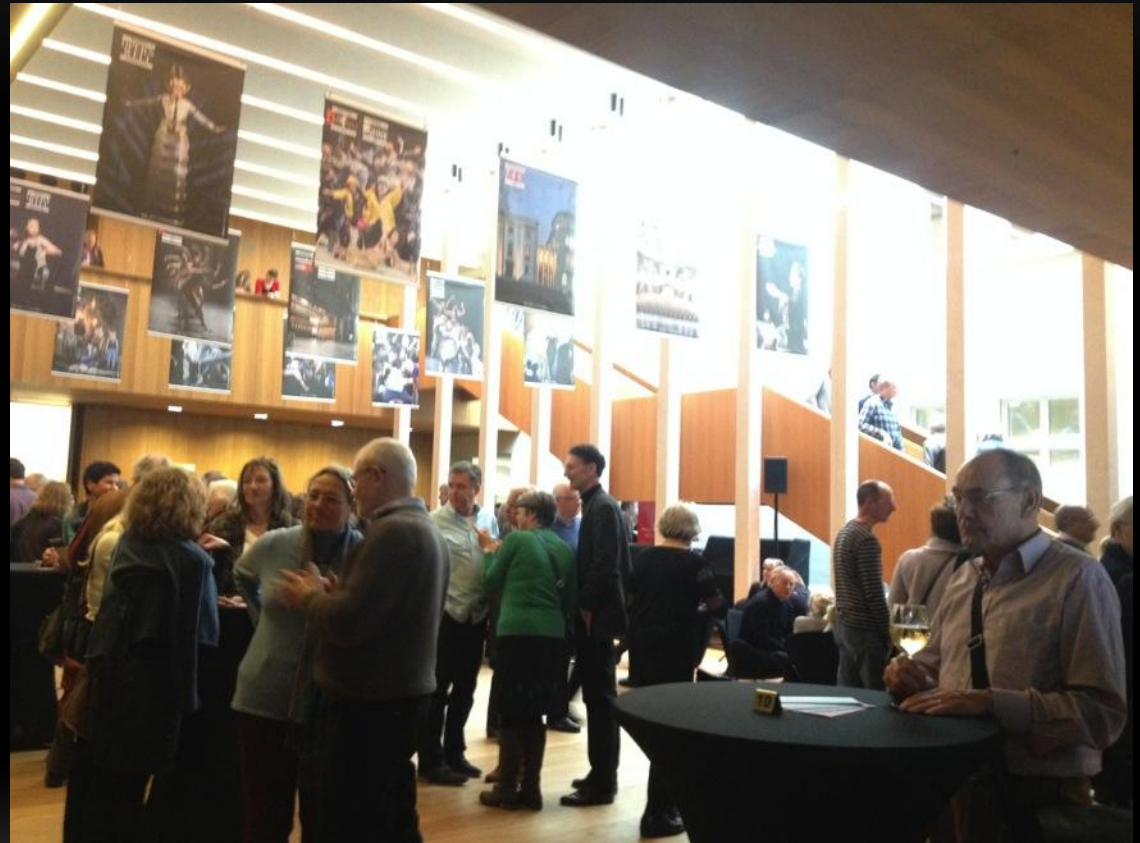
歐洲演出大多都是年紀較大的觀眾