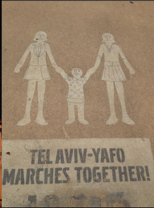
以色列特拉維夫 當地街頭創意