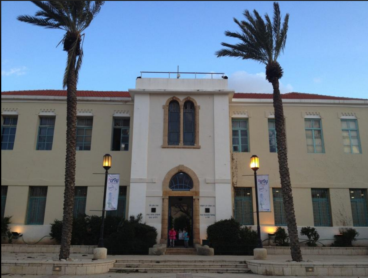
Suzanne Dellal Centre