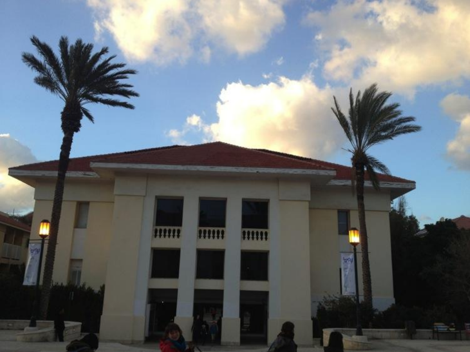
劇場建築（就在舞團的對面）