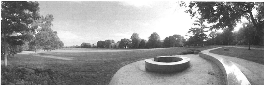
康涅狄格大學校區風景