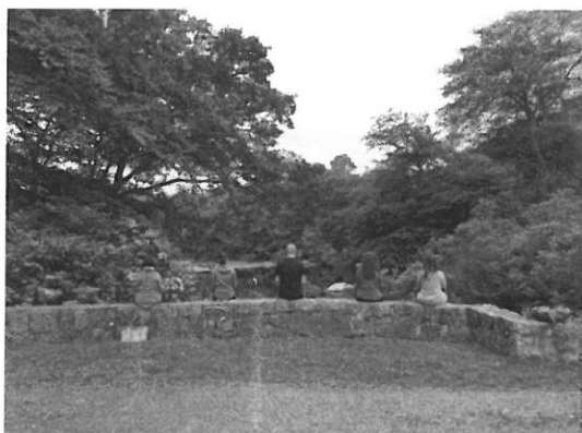
早晨自由參與冥想課程