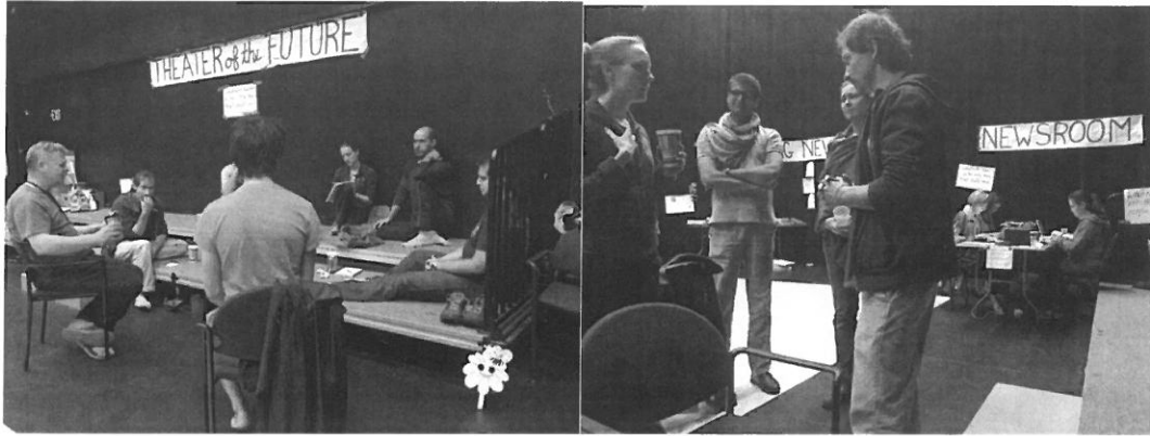
未來劇場論壇第二天