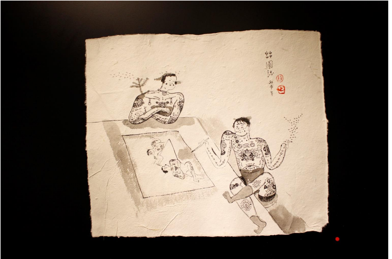
舞圖誌聯合作品完成圖。