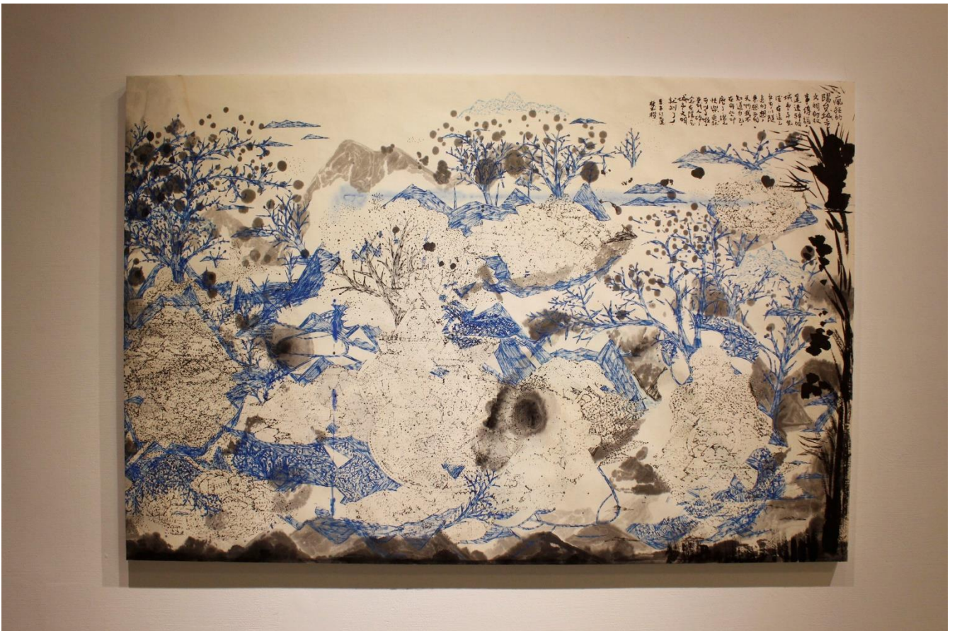
此作品是林書楷較為實驗性的嘗試，將他從陽台俯瞰出的城市光景，在腦中恣意變形拼湊，逐一描繪出一個個奇幻又富有情感的城市景象，圖為作品《陽台城市文明-背景上的風光》。