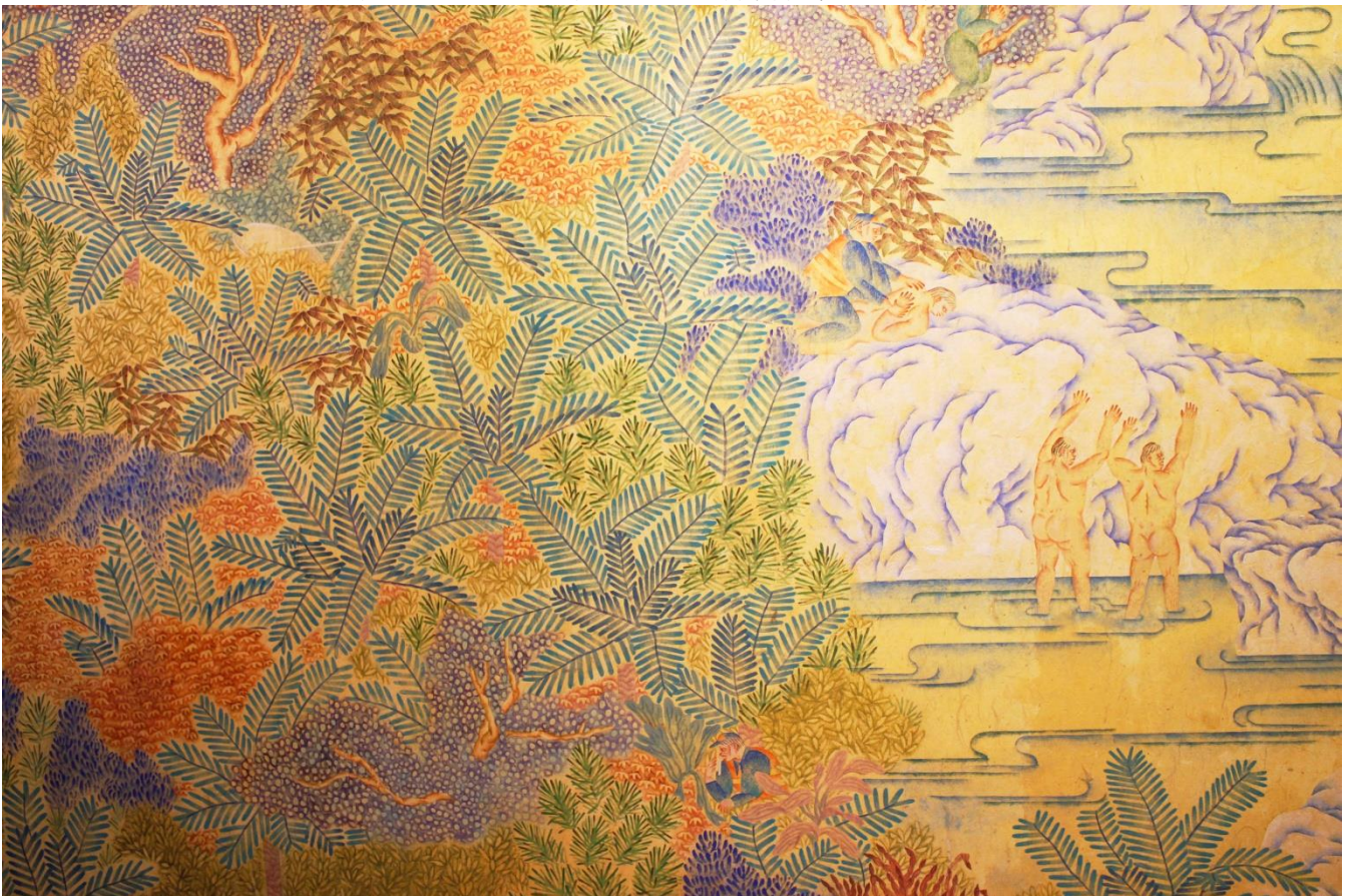
作品《禪下》細節，顏好庭用色技巧純熟，也明顯看出與現今作品的差異，過去的大件彩色作品，均是用礦物顏料堆疊出來，礦物顏料的顏色選擇較少，在創作過程中刻意保留一些筆觸使顏料質地能被看見，但繪製過程也相對繁複。