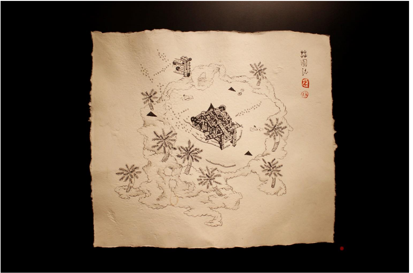
舞圖誌聯合作品完成圖。