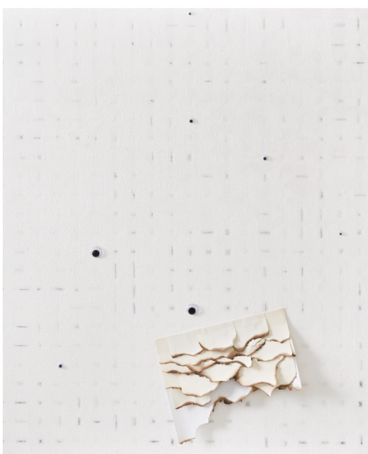
《頓悟》 油彩畫布、便利貼紙、紙、塑膠眼睛 2019 60.5 x 73 cm