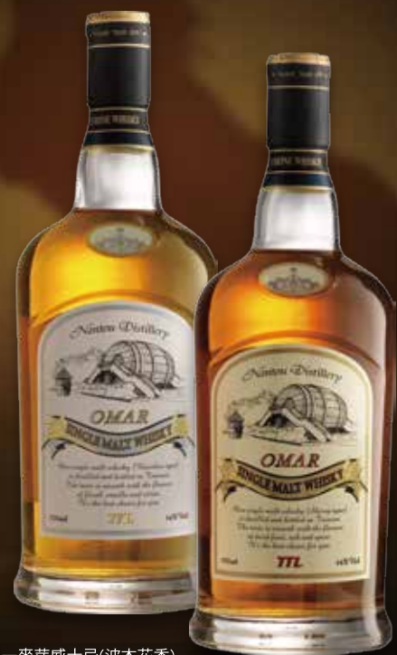
單一麥芽威士忌(波本花香) Bourbon 46% Vol. 700 mL