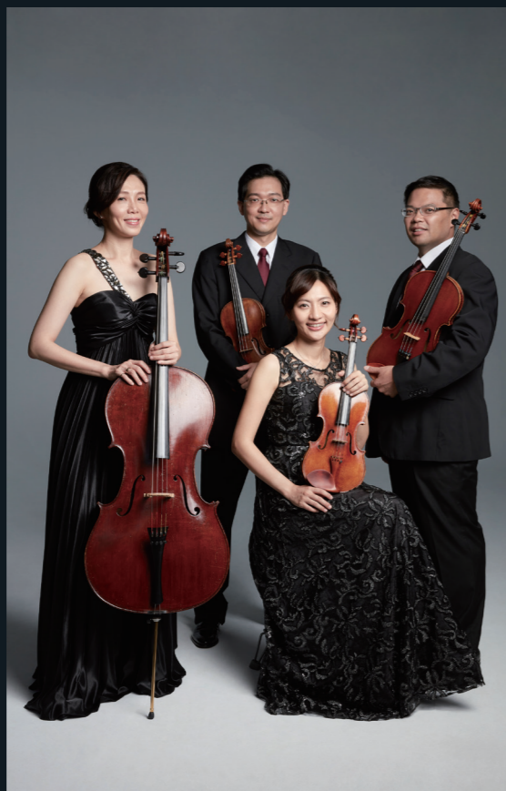
○演出全長約 90 分鐘，含中場休息

Infinite 首席四重奏將再一次超越極限，大膽挑戰高難度曲目，展現弦樂四重奏的最高境界，絕對是所有愛樂者與古典行家不容錯過的音樂饗宴。