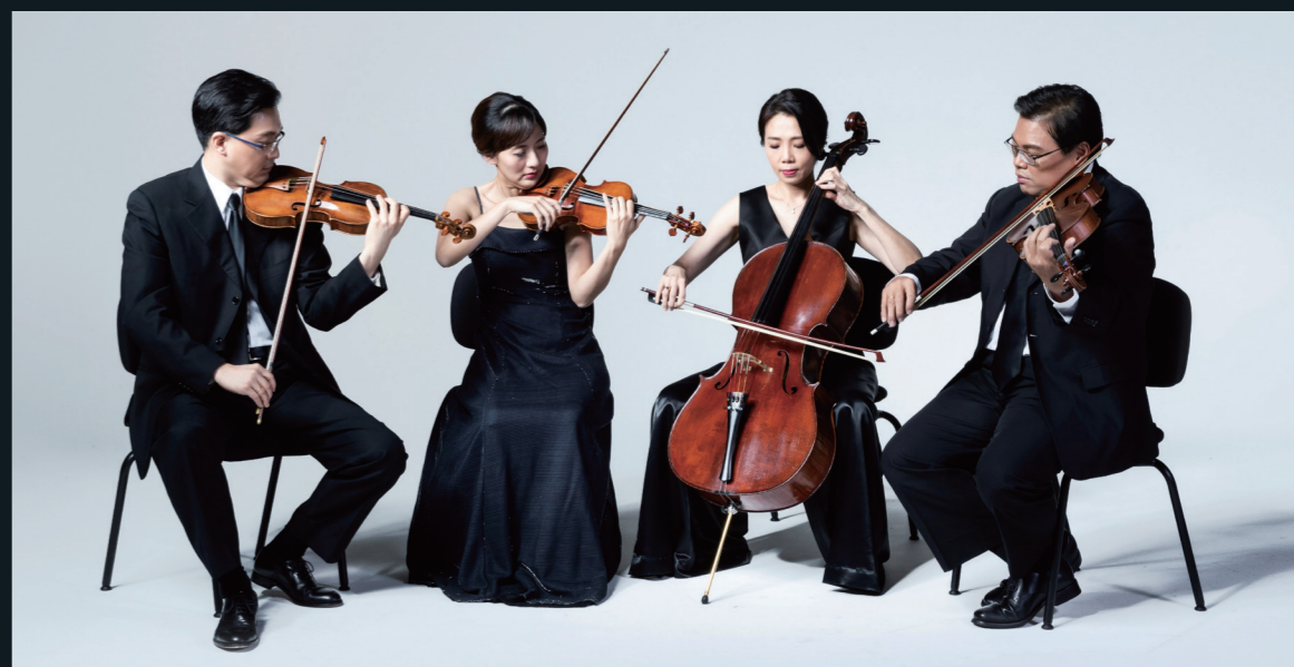
○主辦單位保留演出異動權

延伸第二樂章的小步舞曲風格，成為詠諧曲。這個樂章的前兩個主題具有不規則節拍，第三主題則為中提琴所帶出的，具有諷刺意味的進行曲調。第四樂章藉由低音三聲部與第一小提琴的對話，呈現孤寂、死亡的氣氛。樂章末端主題逐漸移至中提琴，而大提琴斷斷續續如微弱的心跳，不中斷地接續至第五樂章。第五樂章第一主題如默哀般，卻逐漸轉為輕快，具有跑馬歌曲般的節奏。在第一主題回歸後帶到富有張力的段落；兩把小提琴以甚強力度演奏快速重複音，下二聲部則呈卡農演奏誇張的附點節奏。經過第二主題，樂章最後結束在第一主題的片段裡，高音域的處理猶如轉化或昇華。