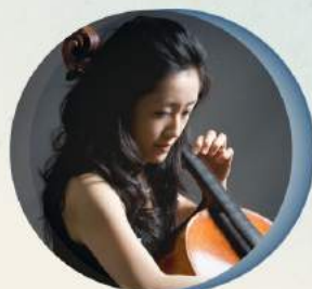
大提琴 / Cello 連亦先 Yi-Shien Lien

以兼具細膩及強烈感染力風格的小提琴演奏家李宜錦，2002年以新秀之姿考取NSO國家交響樂團副首席，2005年升任為樂團首席，在服務了17個樂季，累積了近千場豐富演出經驗後決定轉換職場，於2019年9月應聘為國立台北藝術大學音樂系專任副教授，為下一代年輕學子付出及努力。近年熱心推廣兒童音樂教育，參與發想「NSO媽媽說故事」系列音樂會，並錄製有聲CD，及製作雲門劇場親子音樂會系列，廣受大小朋友的歡迎。出自於對室內樂的熱愛，其領軍的Infinite首席四重奏連續八年受邀於「誠品室內樂節」亮相，並完成台灣演出完整巴爾托克弦樂四重奏的創舉。2019年九月發行小提琴與吉他合奏專輯《調和的靈感》獲選為誠品年中編輯特選 (Editor's Choice)，專輯更入圍第31屆傳藝金曲獎《最佳藝術音樂專輯》、《最佳專輯製作人獎》、《最佳演奏獎》、《最佳錄音獎》等獎項提名，並獲得《最佳演奏獎》殊榮，成績斐然。