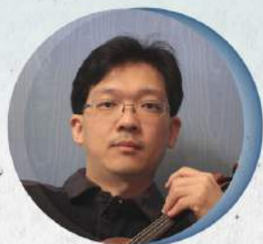
小提琴 / Violin 鄧皓敦 Hao-Tun Teng

生於臺北市，自幼即顯露優越的音樂才能，三歲半由馬孝駿博士啟蒙，先後隨李淑德、鄭俊騰、李麗淑、陳廷輝、吉永禎三等名師習琴，就讀師大附中時期師事蘇正途教授。考入國立藝術學院之後，受教於著名小提琴家林克昌。十七歲時獲得第七屆台北市交協奏曲比賽小提琴組優勝，並入選參加國際太平洋音樂節，赴日研習及演出。大學期間即為台北愛樂室內樂團之邀約團員，之後出任台北名絃管絃樂團首席。曾任長榮交響樂團首席及助理指揮，2004年起擔任甫成立的台北愛樂青年管絃樂團之駐團音樂家，隨即指揮該團參與台北國際合唱音樂節演出。2005-2006夏季應玄音藝術邀請擔任玄音國際音樂節小提琴教授，2010赴維也納任教於歐洲國際音樂節。近年除教學與獨奏會之外，亦積極參與室內樂演出，其中以每年春季的「誠品室內樂節」最受矚目。現職國家交響樂團副首席，並於2022/23樂季擔任代理樂團首席。