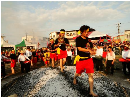
二結王公廟王公生過火儀式(筆者拍攝，2010年，宜蘭五結)

今日二結王公廟的三王公，在每週兩晚的除煞儀式仍扮演最重要的角色，尤以每星期六晚上，我們都能看到許多來自各地的信徒，因病或需要王公除煞而聚集於廟。於是每年「過火儀式」與每週「王公靈力」都不斷在強化與彰顯二結王公廟的地位。