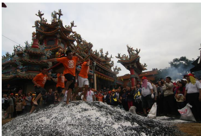
壯圍永鎮廟開漳聖王神誕過火儀式(2017年，宜蘭壯圍)

比較壯圍永鎮廟與二結王公廟在過火的異同，以過火的神聖空間而言，二結王公廟在火場的神聖空間有明顯的方位律定與規範，例如女性不得進入火場範圍，以免破壞火場的神聖性，壯圍永鎮廟則沒有清楚的空間劃定，所以信眾不分男女，也沒有管理階層或觀景台的設計，只要提早到火場旁守候，都能以最佳的位置觀察過火的盛況。