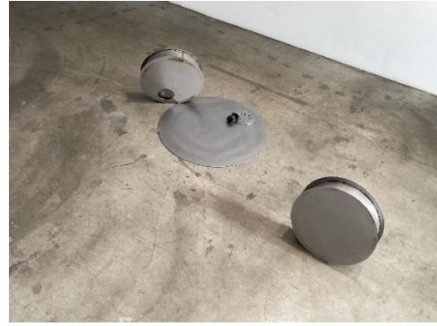
（左）徐瑞謙，《顆粒》(granule)，2023，不鏽鋼、石膏，尺寸依現場地而定。