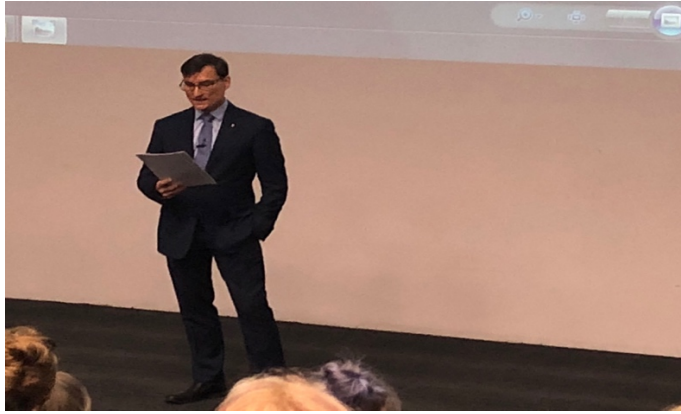
圖片 3：資深芭蕾王子 David McAllister AM 的 Keynote Speech