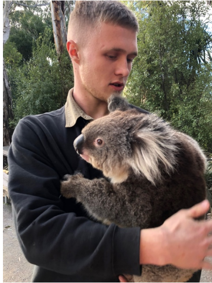
圖片 9: 澳洲最具代表性動物—無尾熊