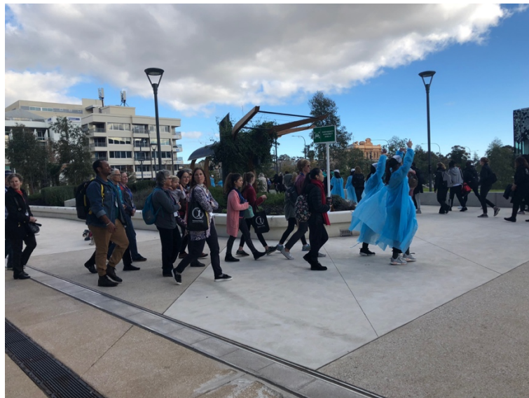
圖片 10: Creative Gathering 演出呈現