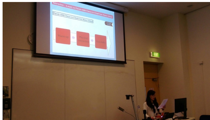
圖片 8: 我的 Pacha Kucha 發表