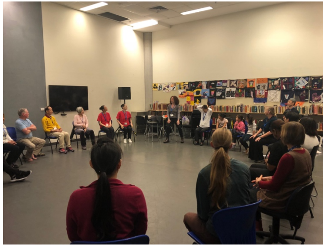
圖片 7: 全程坐在椅子上的 Seated Mature Dance