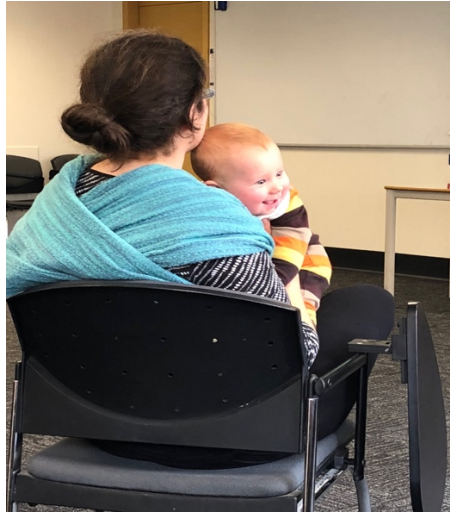
圖片 6: 五個月大的大會參與者