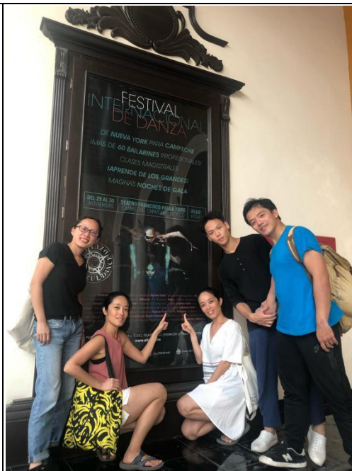
(劇院門口藝術節告示牌)