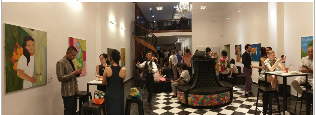
(開幕 GALA 酒會場地)