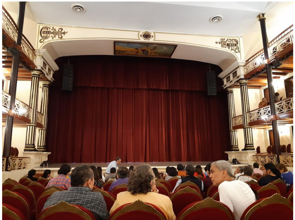
(從觀眾席拍攝舞台)