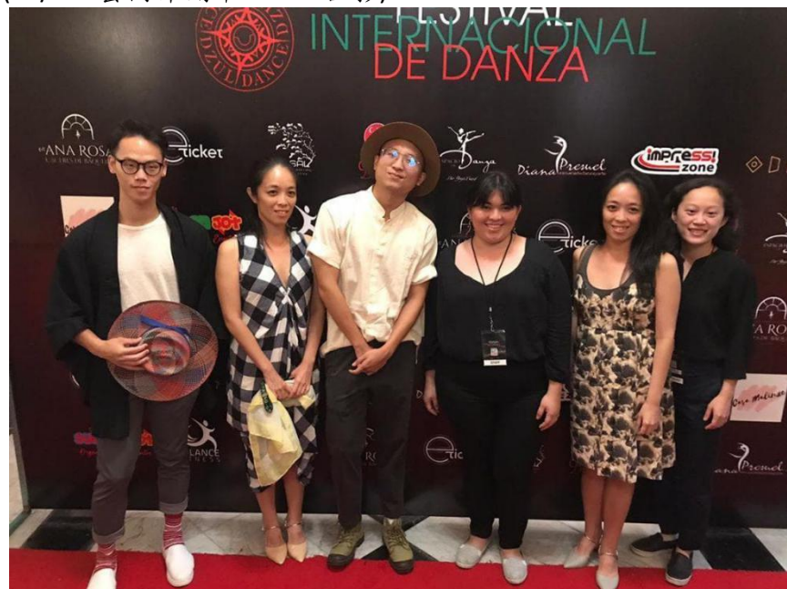
(11/30 藝術節閉幕與當地工作人員合影)