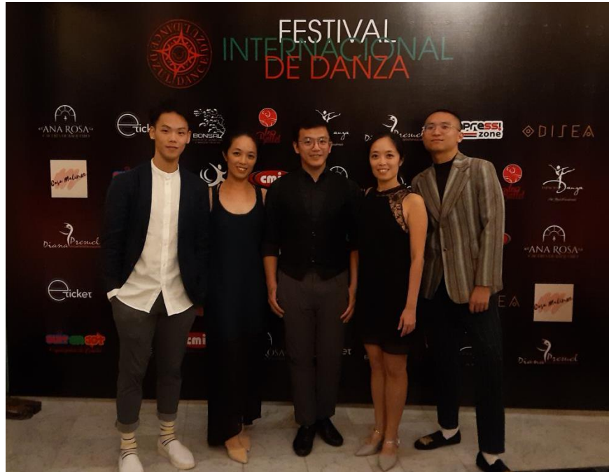
(11/25 藝術節開幕 GALA 合影)