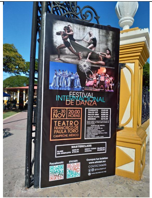
(公園入口藝術節告示牌)