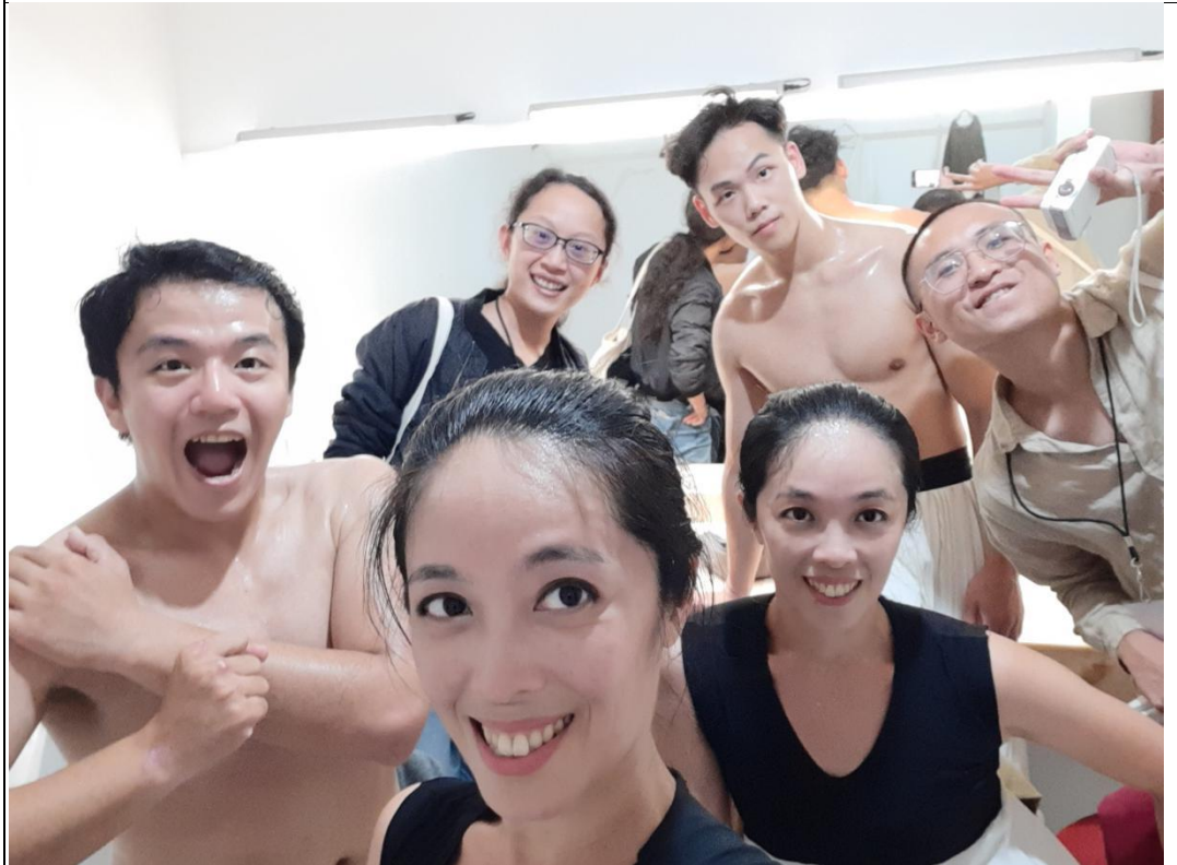
(InTW 成員於演出後化妝室合影)