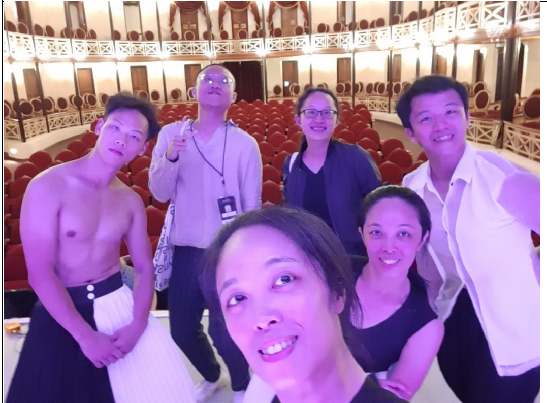
(InTW 成員於彩排後舞台上合影)