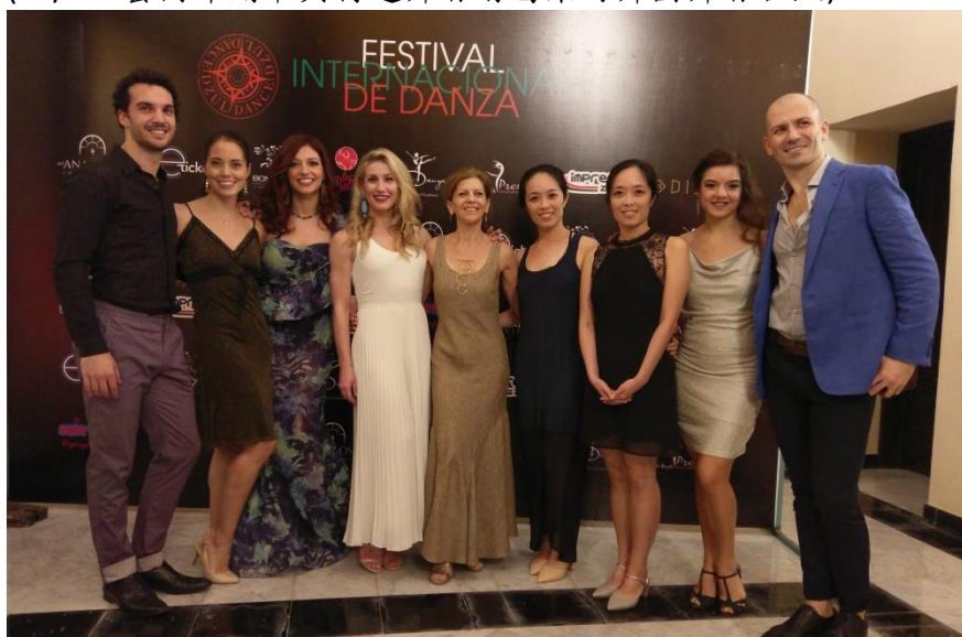
(11/25 藝術節開幕與葛萊姆舞蹈學校校長及校友合照)