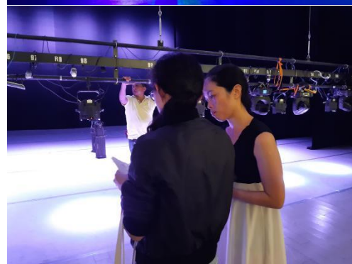
(11/29 InTW 技術彩排工作照)