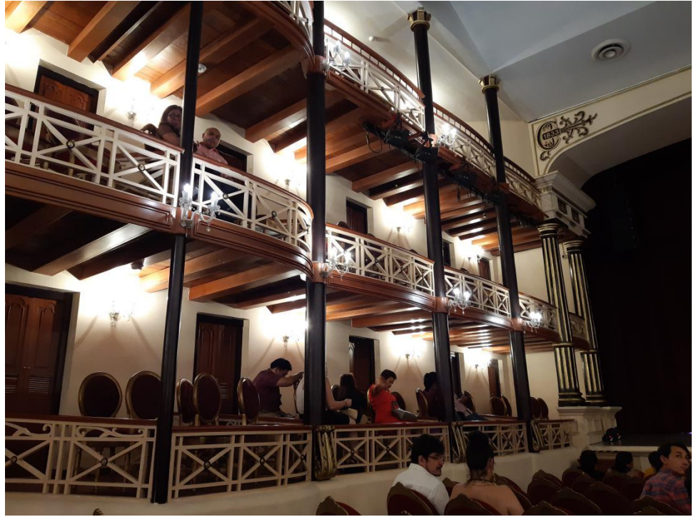
(從觀眾席拍攝左側觀眾席)