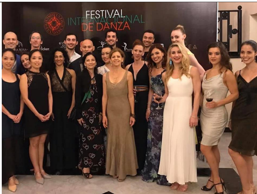
(11/25 藝術節開幕與特邀舞者前葛萊姆舞團舞者合照)