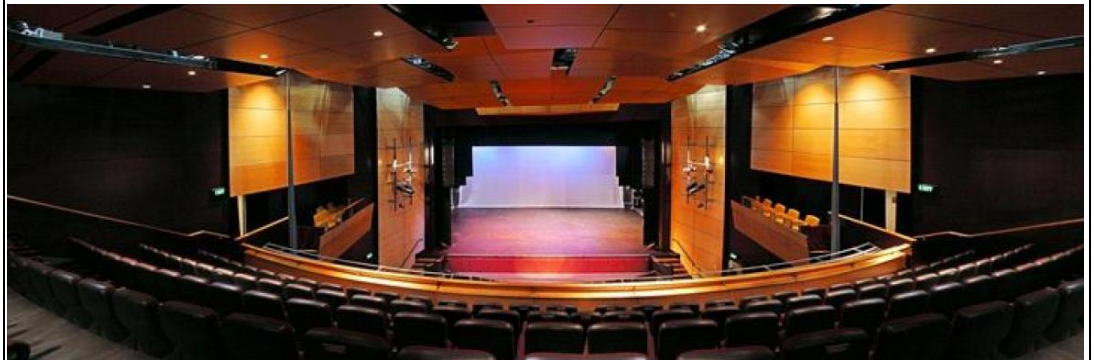
室內空間 (Boardwalk 劇院)