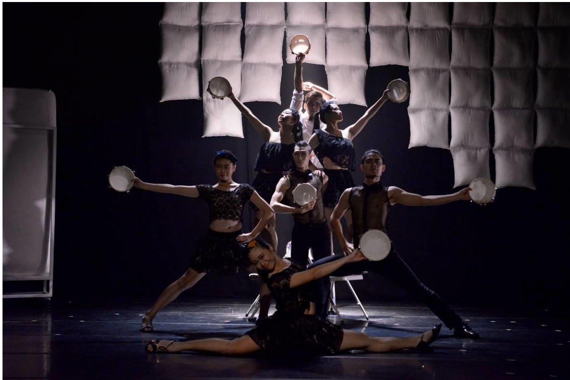
序舞〈Club〉— What is Love? 在五光十色中，進入愛情的魔幻世界。