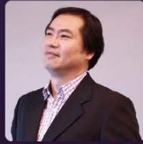
抒情男中音 | 林宜誠