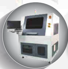
LaserTek / Cutting / Drilling / Scrubbing 各式鐳射製程應用