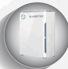
LASERTEK RAYCO 8500 智慧系統-空氣清淨機 抗菌防疫技術應用