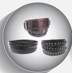
捲裝載帶 Embossed Carrier Tape