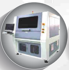
陶瓷鑽孔劃線機 Laser Drilling LR-400 / LD-400