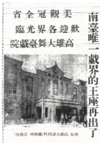
1947年開業的大舞台戲院