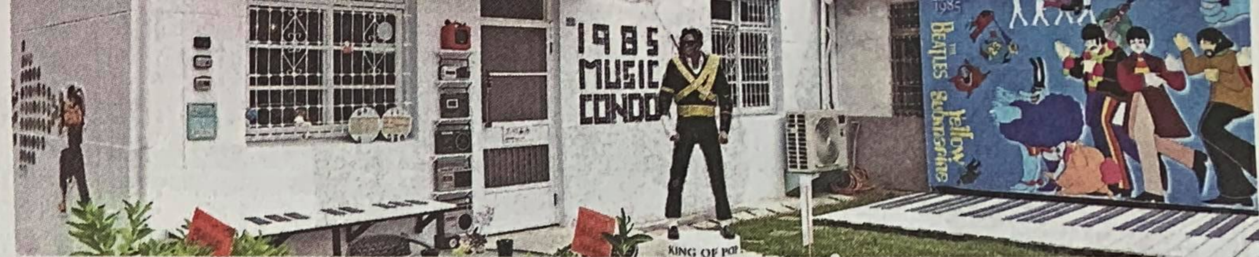
▲◀「省府日常散策」文化創意聚落進駐店家，保留舊有宿舍風貌，僅就空屋外觀及內部輕度修繕。