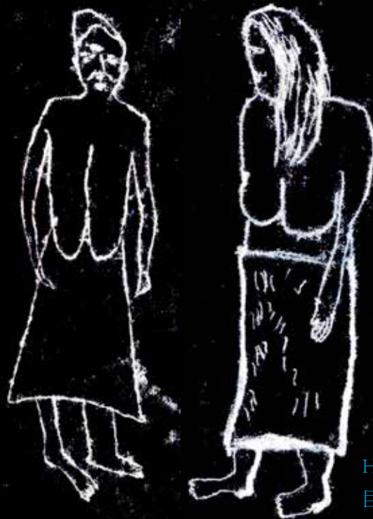
Hantu kopek 巨乳鬼

據說老輩人為了恐嚇小孩在天黑前要進屋，而編此故事。因為黃昏時光線變弱，鄉野地方易有野生動物出沒，或光腳丫玩的孩子易踩到刺、釘子等尖銳物而受傷。也有一說是黃昏時老虎常出沒於村落邊緣，巨乳鬼的出現其實是保護幼童。