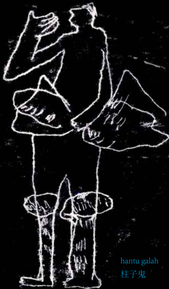
hantu galah 柱子鬼