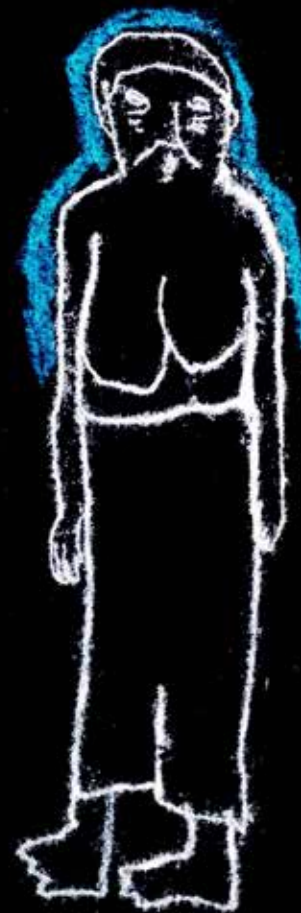
Hantu kopek 巨乳鬼