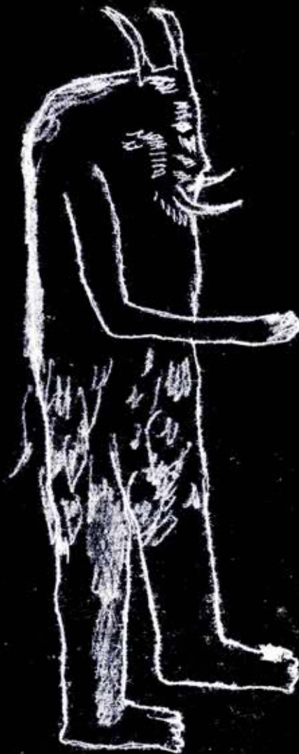
Sang Kelembai 森林鬼

佔據山或森林的鬼。是一種特別令小孩害怕的鬼。特別討厭吵鬧，因此，在森林或山中不宜喧鬧。若打擾了牠，牠會讓人變成石頭。山裡有些若人形或動物形的石頭便是打擾山鬼的下場。也有此說是老輩為了防止孩童在林中吵鬧而編的禁忌。