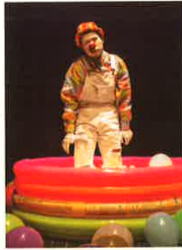
《糖糖先生的戀愛物語》