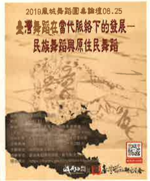
《風城舞蹈圓桌論壇》