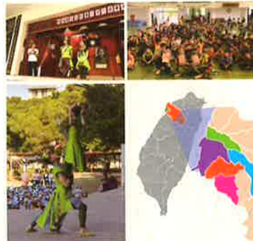
《五色鳥飛向偏鄉》藝進新竹縣市18所校園