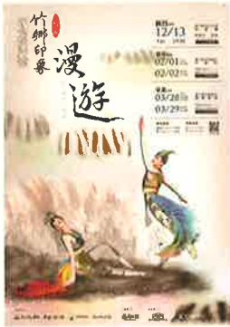
《竹鄉印象二部曲-漫遊》