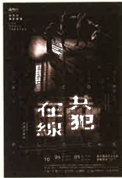
《共犯在線》沉浸式劇場