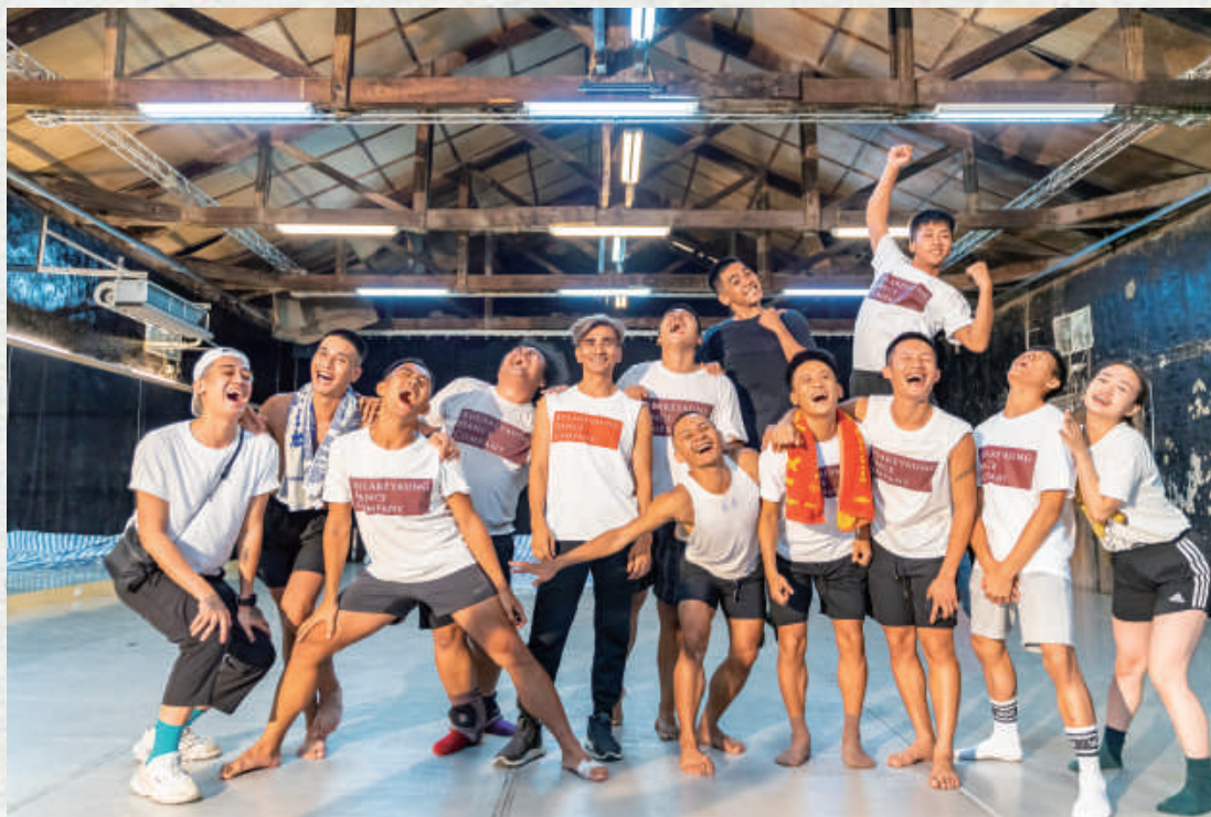
主辦單位 | 布拉瑞揚舞團文化基金會、雲門文化藝術基金會