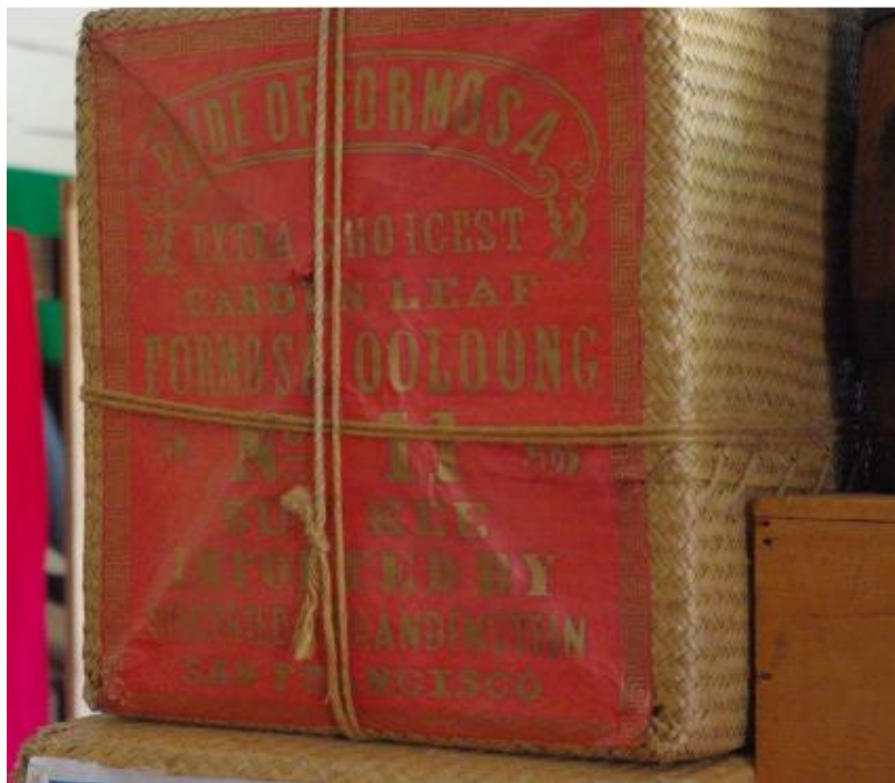
圖表 2：茶箱外加編一層竹篾外套或包以蔴布草蓆，包外刷印商標以及出口規定之中英字樣，最後綑以蔴繩。

從晚清到日治時期，茶葉是臺灣最具有經濟效益的臺灣物產，有關臺灣烏龍茶茶箱現有保留的紀錄甚少，臺灣茶業貿易前期附屬於中國茶貿易，其茶箱型式與外箱貼覆茶箱圖紙的資料多半是夾雜延伸自中國茶貿易的資料中，資料零散且簡略，相較於日治時期對於臺灣茶業對外行銷與拓展影響，資料可參考性較高，大量的臺灣茶行銷海外，而茶箱就是茶葉外銷時的載體，早期為木製茶箱，便於海外運送，茶箱外層有木板包覆，並加上竹編保護，箱內襯紙且有鉛、錫製隔層防潮保護，以免茶葉受損，茶箱是茶葉貿易發展歷史的最好見證，茶箱外的茶圖則是述說那段茶葉貿易歷史的解說員，透過解構茶箱圖文密碼一窺輝煌的臺茶海外旅程。