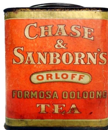
圖表 9：ORLFF Formosa Oolong Tea, Chase & Sanborn's (1900s)