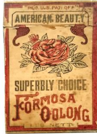
圖表 5：American Beauty Formosa Oolong Tin