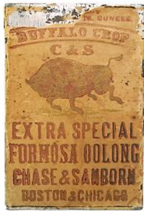
圖表 4：Buffalo Chop Formosa Oolong Tin, Chase & Sanborn (1890s)