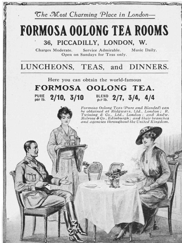
圖表 10：倫敦最迷人地點 Formosa Tea Room

流通於英國上流社會階層的雜誌 The Tatler 1916 年所刊登的 Formosa Oolong Tea Room 廣告(1916) Advertisement for the Formosa Oolong Tea-Rooms, The Tatler, no. 783, 28 June 1916: 33.