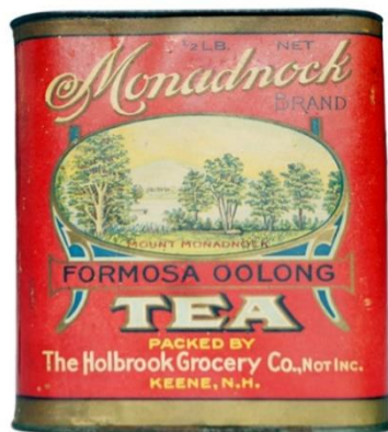
圖表 8：Monadnock Formosa Oolong Tea, Holbrook Grocery Company of Keene, New Hampshire