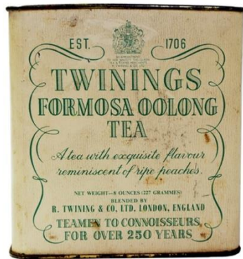
圖表 6：Twining's Formosa Oolong Tin