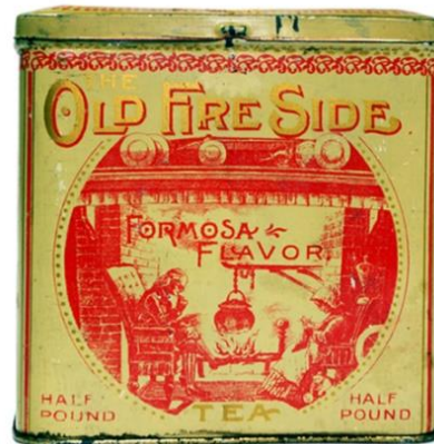
圖表 7：Old Fire Side Formosa Oolong