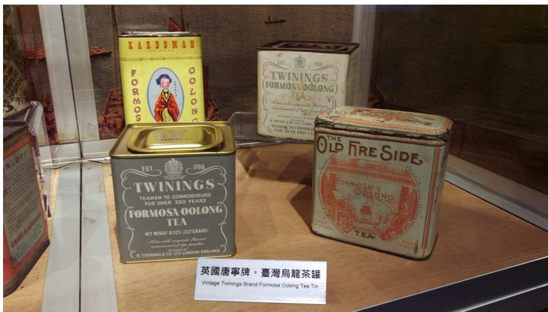
圖表 3：早期行銷海外的臺灣烏龍茶商品

茶是最早的全球化貿易商品，廣泛影響全球消費市場，當茶是來之不易的東方文化商品與奢侈品時，茶葉在上流社會中被保存於高貴的精緻銀或是錫製茶葉盒中；隨著茶葉逐漸普及於各個階層，當茶葉從東方木箱裝運抵歐美市場時，茶是第一種被包裝在金屬容器中且大量流通於消費市場的食品，最初英國廣泛使用的馬口鐵罐製作東方風格的茶葉容器，鍍錫鐵就被製成各種茶葉罐；這股風潮擴展到美國市場後，透過這種標準化、定量化，流行化且帶有濃厚商業設計風格的茶葉罐商品大量出現在消費者眼前，這種新的茶葉包裝型式深受消費市場歡迎。