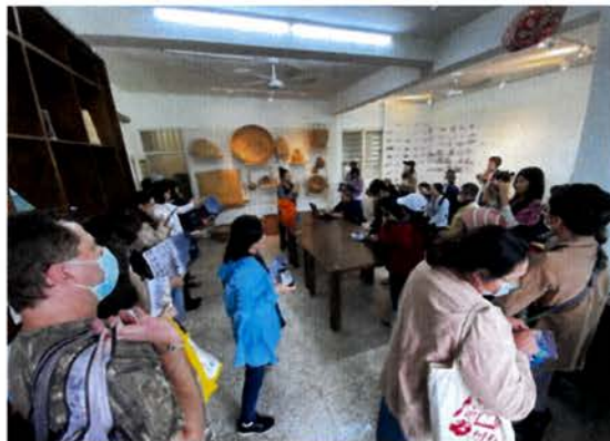
台灣工藝美術學校來訪