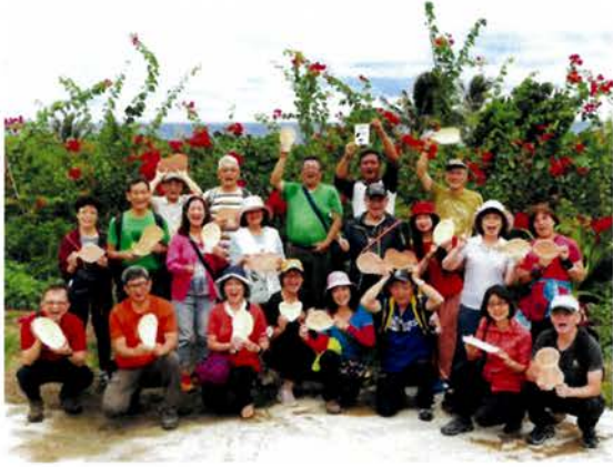
瘋馬旅行社遊客來訪並做木作體驗