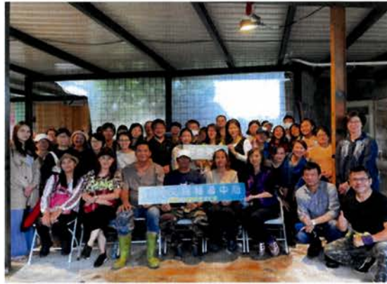
宜蘭文創輔導中心帶工藝師來訪