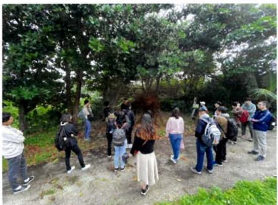
台大地理系師生來訪