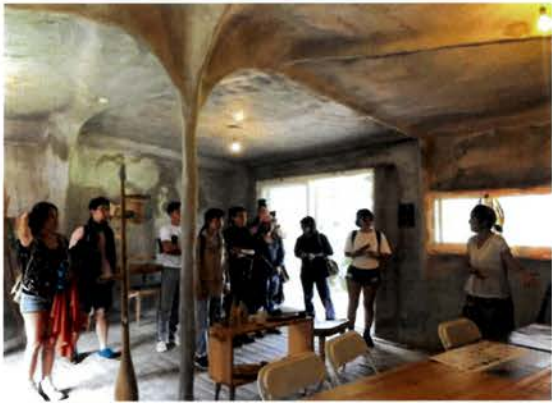
Mtukuy 播番者計畫策展人及藝術家來訪