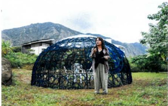
藝術家安聖惠開幕作品導覽

開幕現場由策展人及藝術家導覽其作品，讓來訪的民眾加深對作品內涵的理解，走訪的過程也可以感受藝術家作品與空間環境之間的關係，以及體會自然環境中的創作的能量。在開幕之後，陸續各地學校師生及參訪團等來訪，由藝術家、策展人或在地族人導覽。經由導覽解說，將觀眾帶入藝術家語境，並期望展覽能人對於海洋有新的認識與體悟。