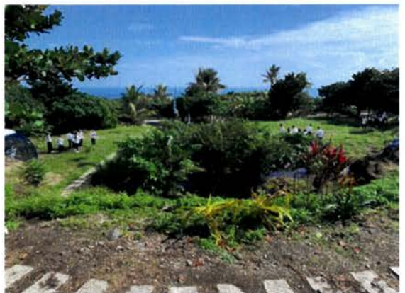
慈濟大學師生來訪