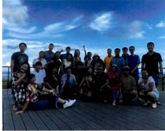
公益平台花東永續共學群來訪