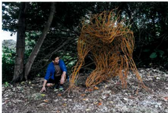
藝術家伊祐噶照開幕作品導覽