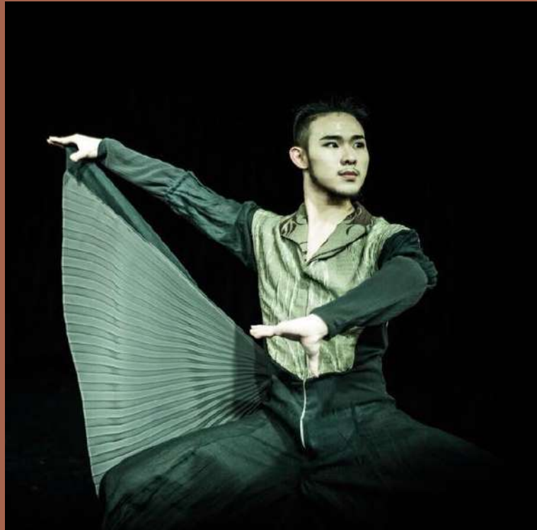
工作坊講師 | 肢體