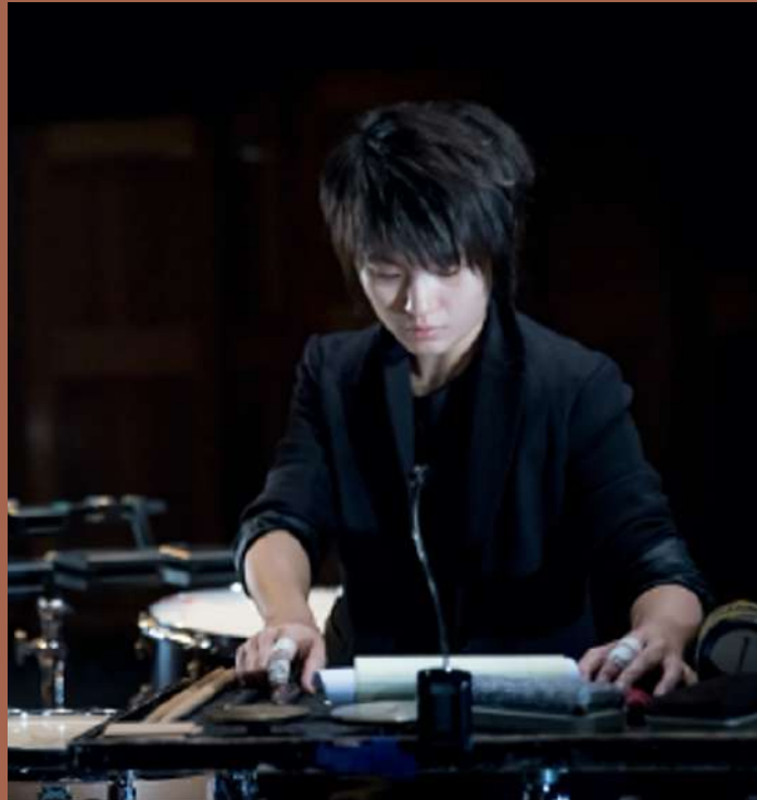
工作坊講師 | 聲響