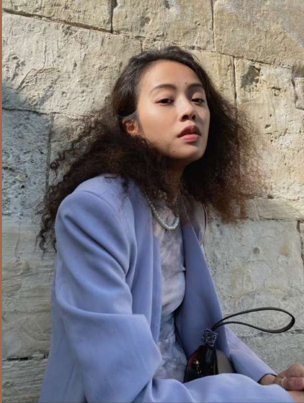
工作坊講師 | 觸覺