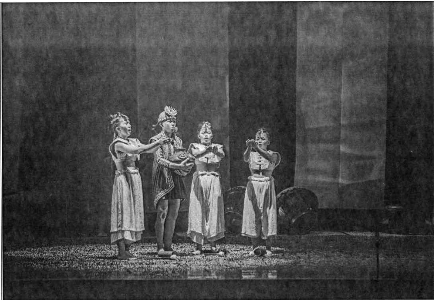
tiativ-末代山林·衝擊

《tiativ—末代山林·衝擊》這部作品，雖然說長不長、說短不短，但六十分鐘的演出時間，已有十足誠意和努力去整理布農族古謠的音樂內涵精神，因此，無論是音樂、服裝、圖騰彩繪、肢體編排，都能在其中看到許多排灣族文化素材的身影。整場演出無疑是多元且豐富，除了給予觀眾聽覺上的洗禮，更在說書人溫暖的話語又帶點感性的情感中，增加現場觀眾對於原住民文化的認識。