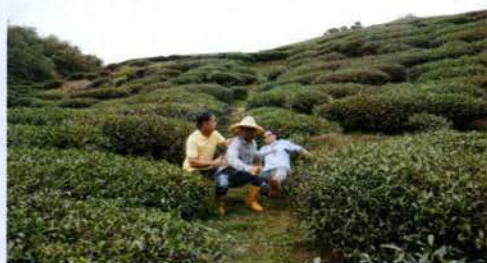
△《NALAM》劇照及放映活動現場

我覺得這裡產生了一種翻譯的關係。但這種翻譯關係變得有趣的地方在於，例如Nalam被逮捕的照片展示了他被逮捕時並不害怕，所以留下了一張姿勢像鴨子的照片。那個姿勢和身體的樣子是一種懲戒的思考，經過加工後成為經典的畫面，當時我們覺得這是藝術領域的影像。但即使這個影像真實地呈現在現實中，它也能讓你以一個似乎對現實的理解找到另一個管道或視角來觀看。這個視角不是現實的視角，而是來自藝術領域的視角去理解。這種理解關係有點特別，因為它不太成熟。我想舉個例子來描述這種特別的感覺，就像我很喜歡的日本藝術家赤瀨川原平一樣。他的創作一直以來都有一種奇怪的邏輯，就是用藝術來詮釋現實世界。例如他在路上看到的抽象繪畫實際上只是一個人在用肥皂水擦拭玻璃窗，他其實是幫你找到一個在現實邏輯以外，可以去記錄現實跟詮釋現實的一個蠻重要的方法。而且這個詮釋中他沒那麼快帶入倫理判斷或價值判斷的層面，所以他可以允許創作者在這個從業裡獲得更大的……你說遲疑也好，想像或駐足，我印象就停在那個位置去想一些事情。光這件事來說，並不是立即有一個概念，或是進入一個批判的拆解位置，而是選擇停留在那個影像和畫面駐足。