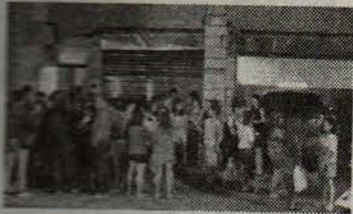
越南籍移工集體在街邊抗議所屬仲介公司苛刻對待。

新 北市汐止區街頭，23日深夜聚集了上百位女性越南籍移工，集體在街邊抗議所屬仲介公司苛刻對待。她們不滿雇主涉苛扣住宿費、餐點費等費用，伙食不佳，加上冬天熱水不夠用、夏天繳了電費卻不能吹冷氣，生活品質極差，讓她們苦不堪言。有移工表示已多次向公司反映，卻沒得到答覆，忍無可忍之下才會集體站出來抗議。晚間第一輪抗議因人數眾多、聲音吵雜，警方獲報後到場勸導，表示聚集的移工已經妨礙安寧，要她們先進去休息。仲介公司也透過翻譯要求移工快回宿舍，並表示公司會派人處理。到24號凌晨，第二批剛下班的移工回到宿舍，又再次聚集，警方到場進行第二次勸離，新北市勞工局緊急介入，展開調查。