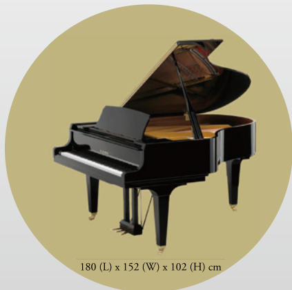
180 (L) x 152 (W) x 102 (H) cm