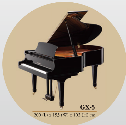
GX-5 200 (L) x 153 (W) x 102 (H) cm