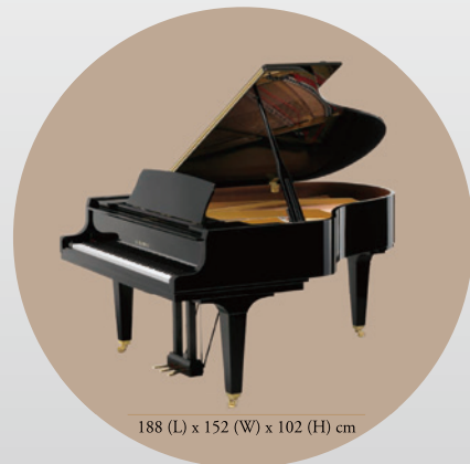
188 (L) x 152 (W) x 102 (H) cm