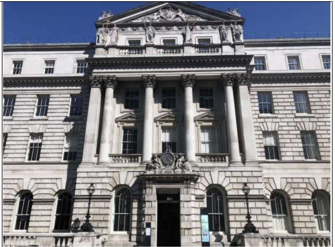
Somerset House 索墨塞特府 G16 房間