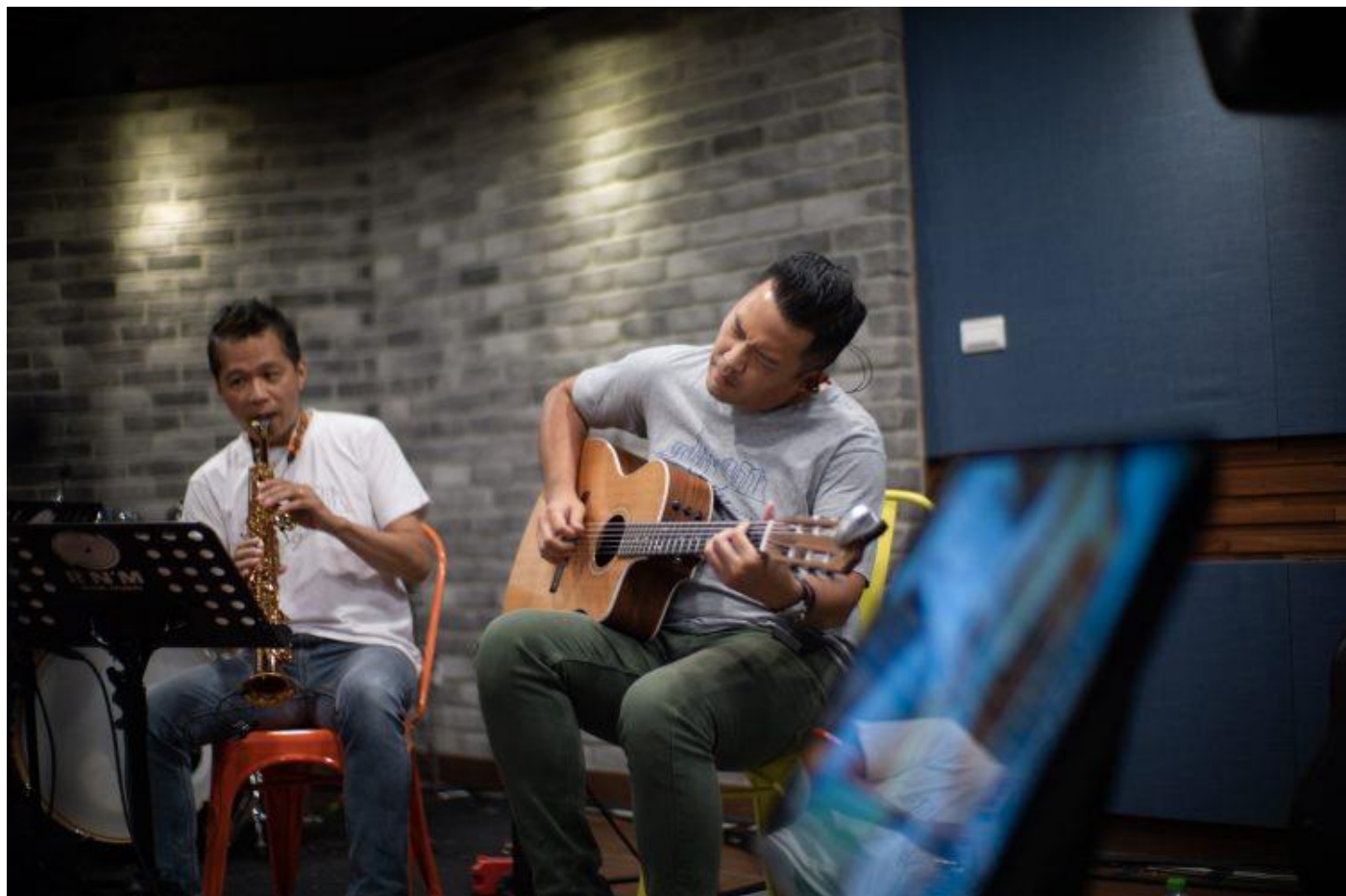
Skyline Jazz Band Skyline 線上「金曲趴」