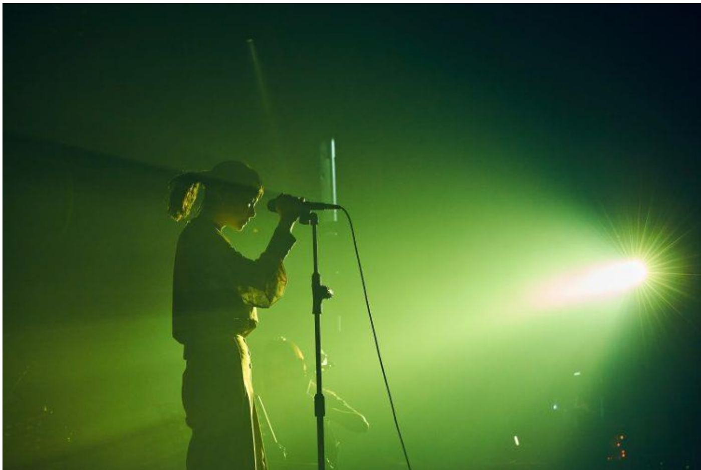
大港開唱 2022

「絕代風華」如此特別，它不僅賦予電影配樂現場演出獨有的感官體驗，也讓《大港開唱》除了在穩健中延續理念，也展現新企圖。當一個廣為觀眾所愛，票券快速售罄的音樂節，仍帶來驚喜，成就這麼一場音樂及視覺的完整度都甚高，且別處看不到的限定演出，或許我們能持續期許：期許精彩的創作及表演者擁有足夠的資源，能以更多方式繼續讓觀眾讚嘆屏息；也期待《大港開唱》能持續擁有品味與高度，帶領觀眾走得更深更遠，一探音樂演出豐富的可能，以及卓越音樂人孕育成就的絕代風華。