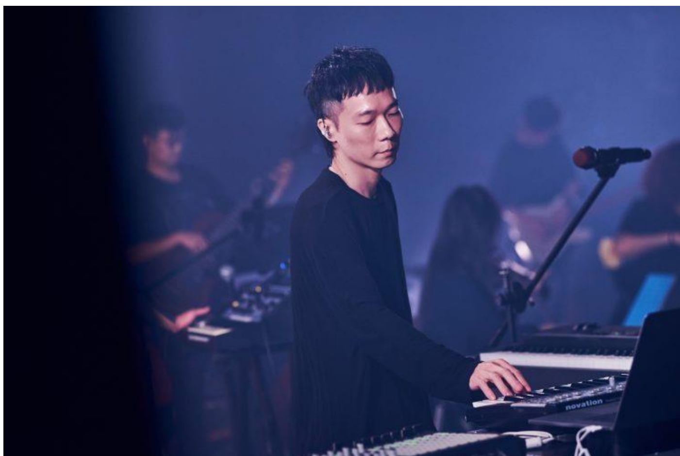
大港開唱 2022