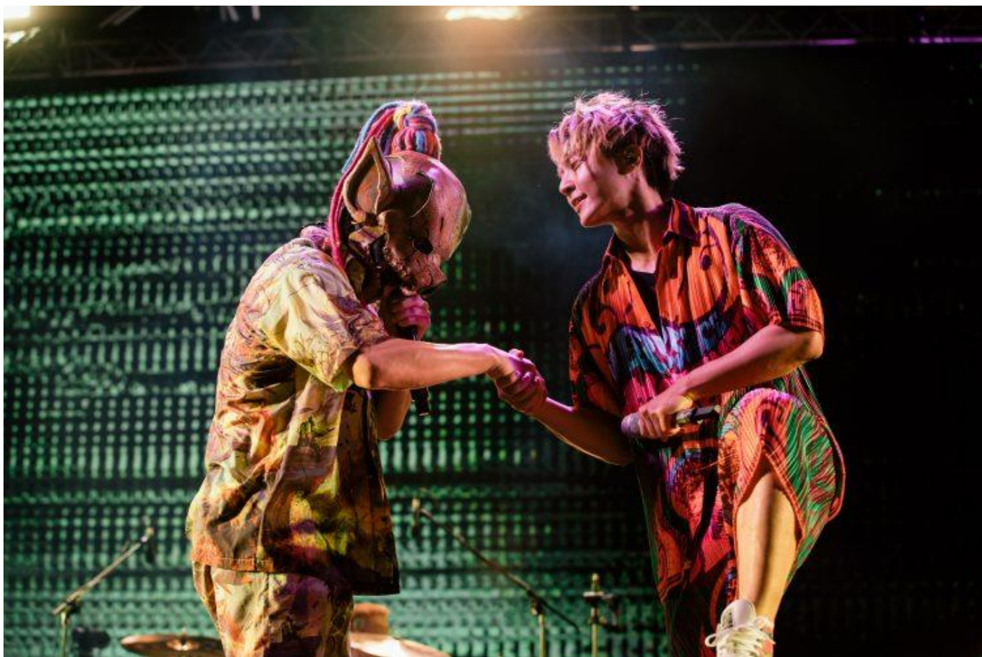
大港開唱 2022