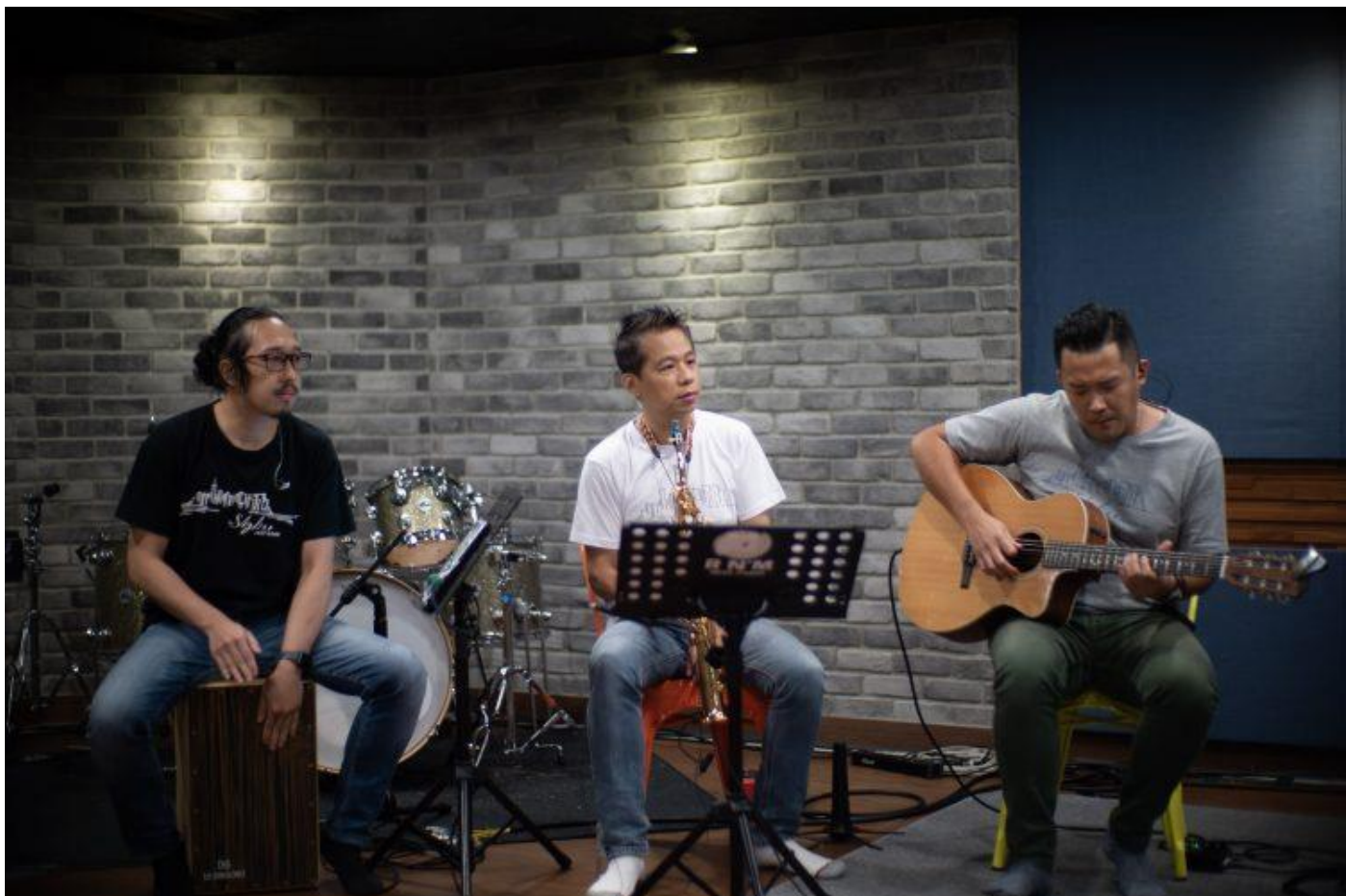
Skyline Jazz Band Skyline 線上「金曲趴」