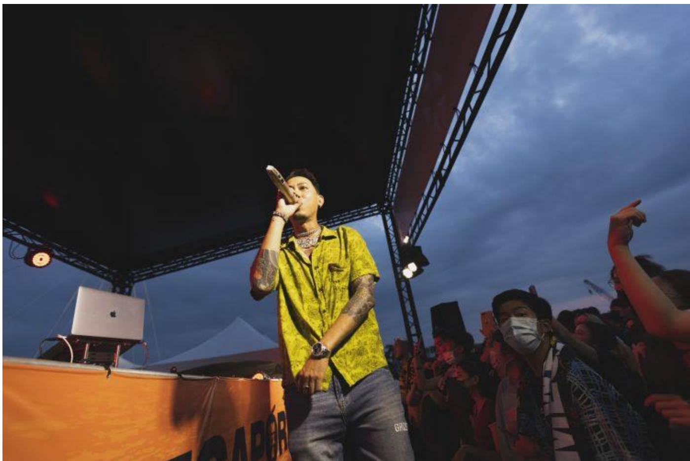
大港開唱 2022