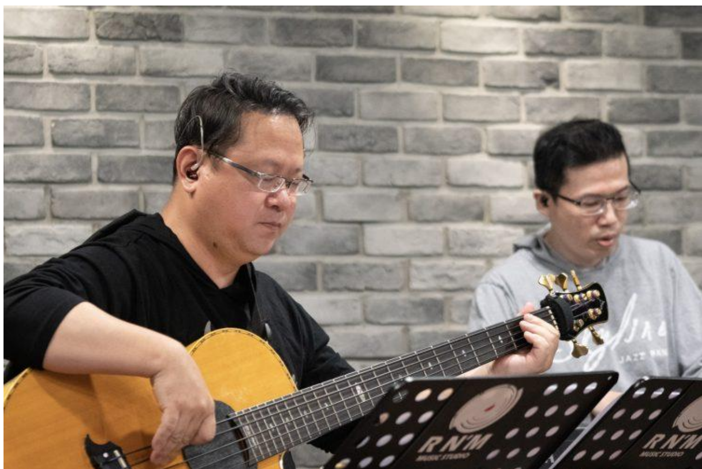
Skyline Jazz Band Skyline 線上「金曲趴」