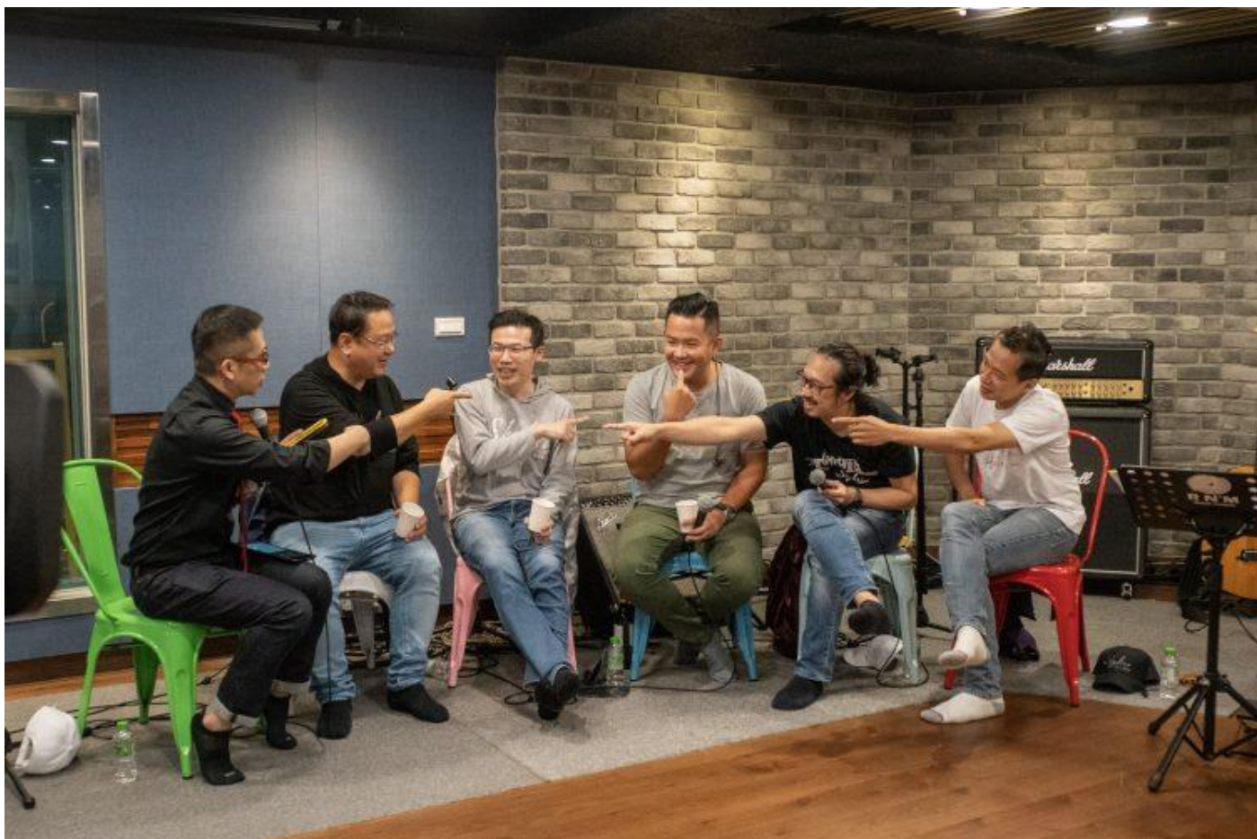
Skyline Jazz Band Skyline 線上「金曲趴」