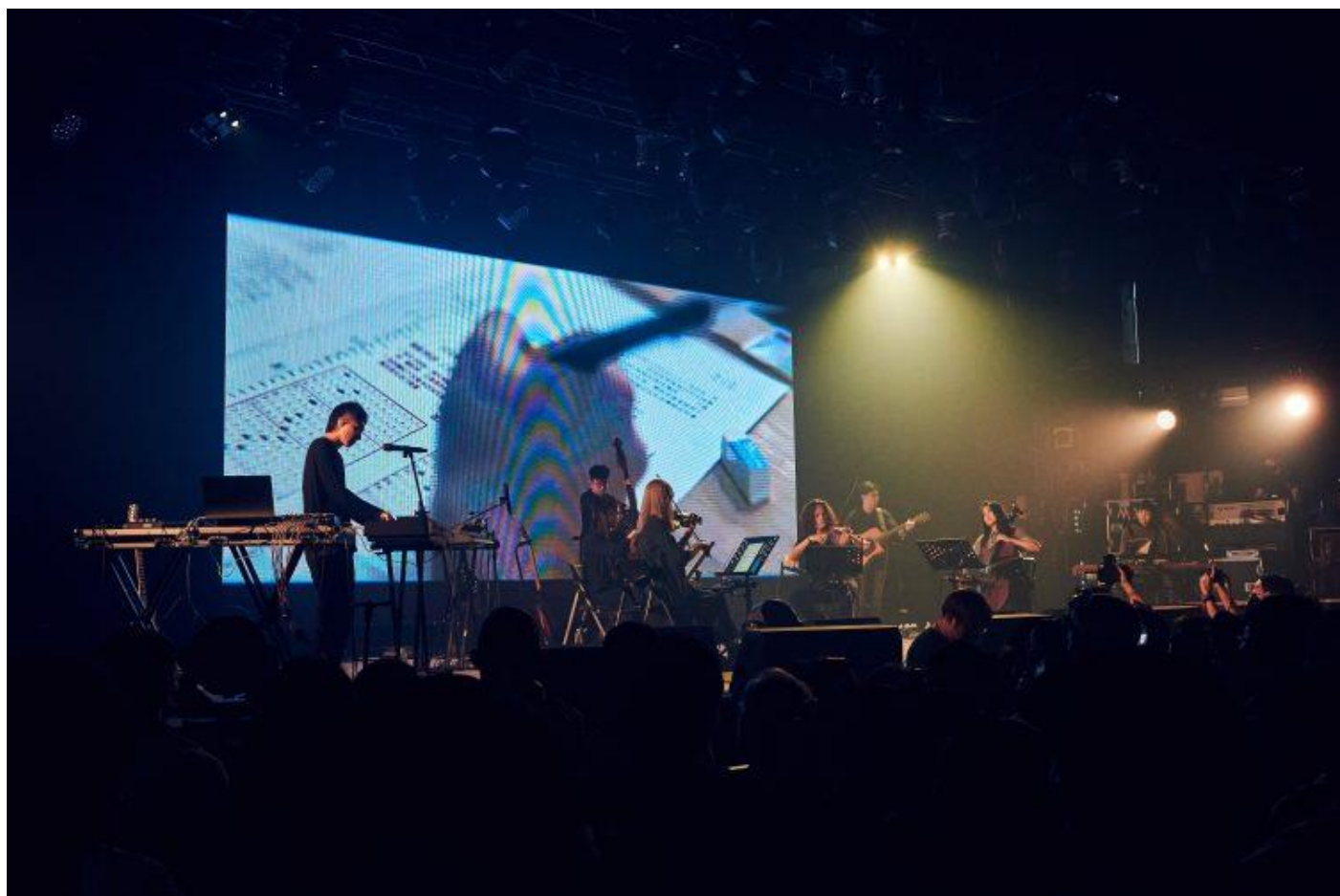
大港開唱 2022