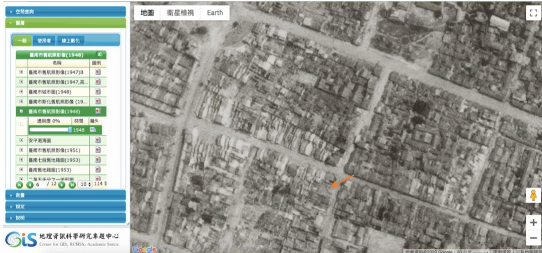
*戰時 1945 年至戰後 1948 年之間〈臺南市航照影像〉。