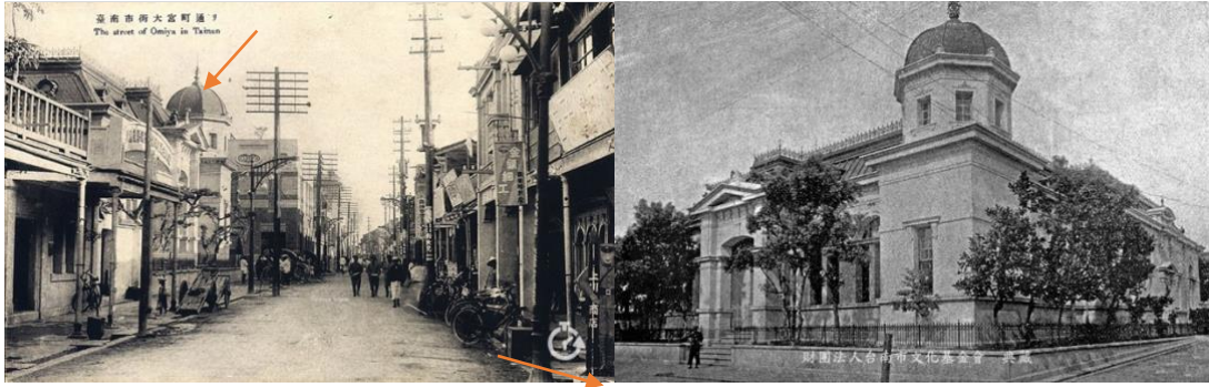
*左圖：1930 年大宮町通。上箭頭所在為臺灣銀行；下箭頭為全美戲院現址所在，圖右下的上川商店再前方。