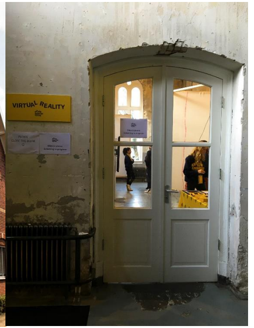
002_機械庫房內虛擬實境展區入口