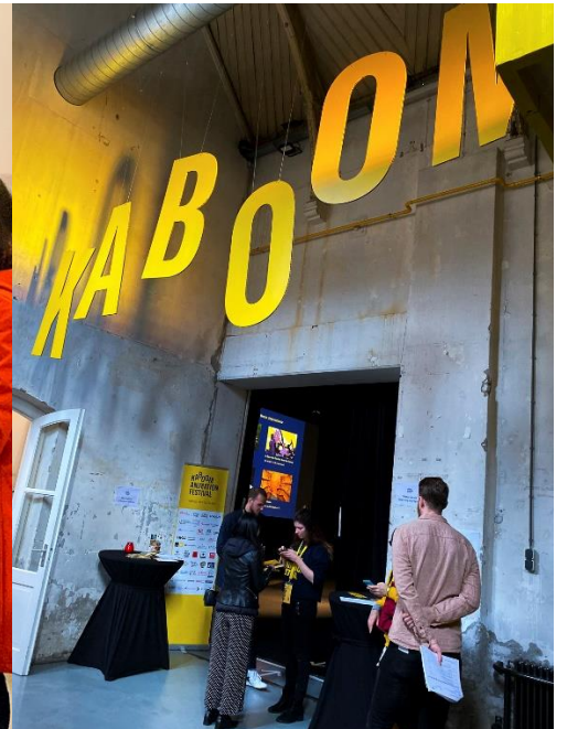
004_機械庫房內影院區入口