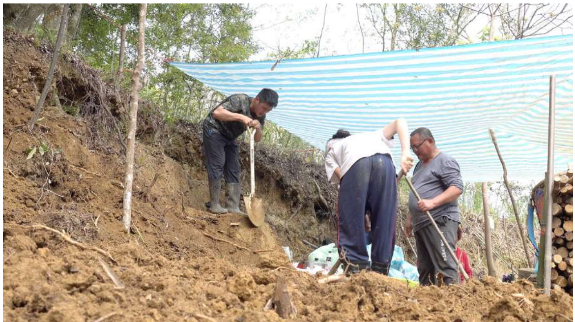
工寮搭建、挖掘土地，製造平地、土牆遮蔽處