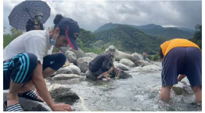
在中港溪河畔清洗苧麻纖維