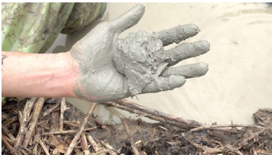
黏度相當高，質地純粹無雜質