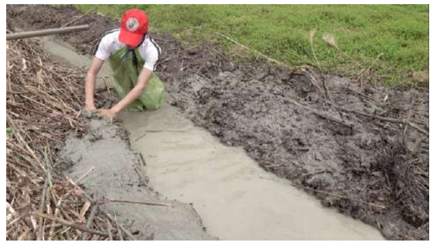
挖掘 lese: (黏土、泥土)