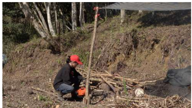
就地取材搭建工寮