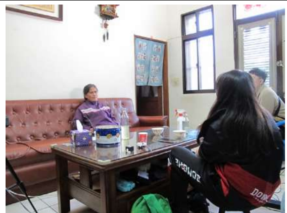
兩位織女老師訪談