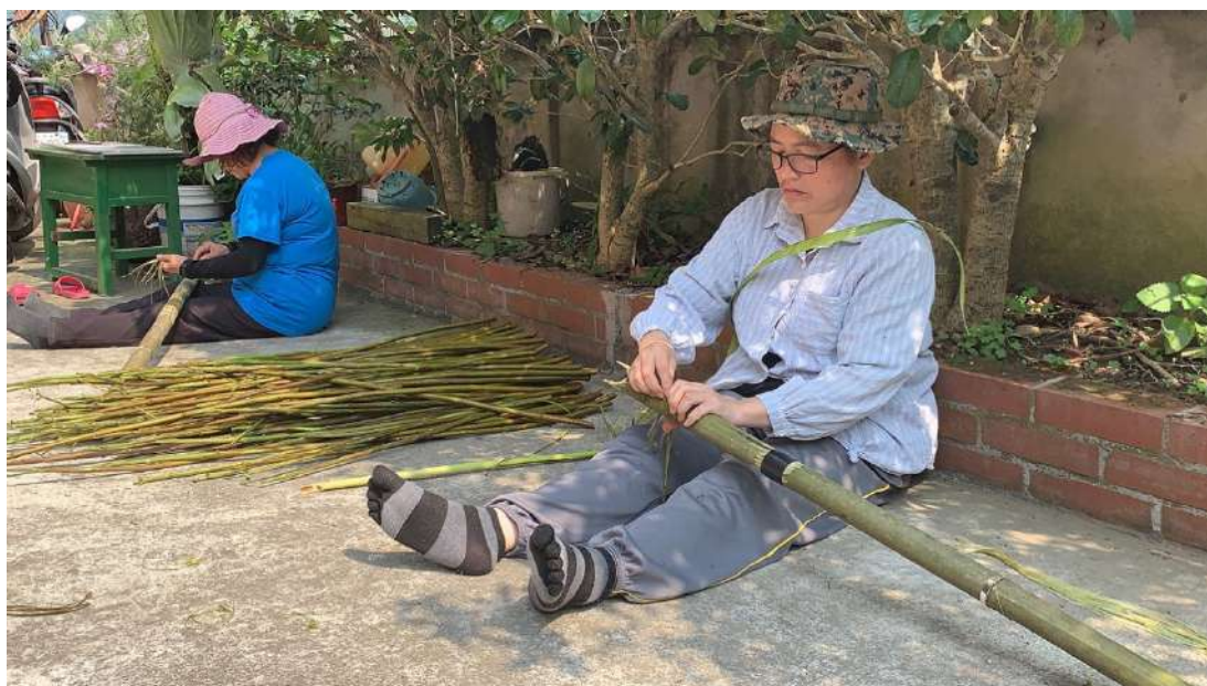
用傳統竹製刮麻器刮取苧麻，取其纖維

編織一事展現女性在族群中的重要地位，賽夏族有著穩固的氏族組織，然父系社會傳承之下的族群，部落中大大小小的事只有男人有決策權，而因為編織在當代社會中彰顯了女性在族群中的重要性，女性在文化傳承、知識實踐上都有著不可抹滅的溫柔卻也剛毅的性格與能力。