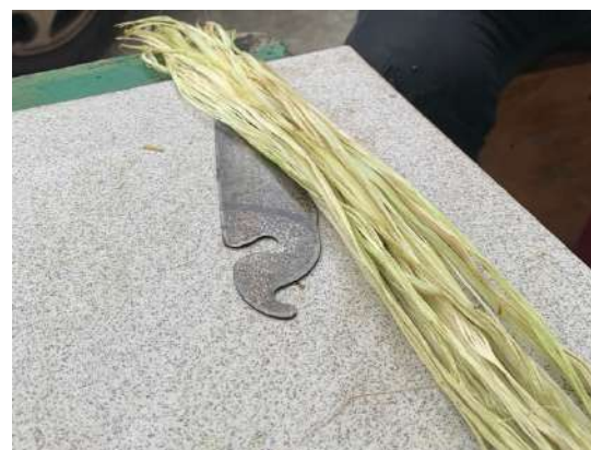
刮完後的苧麻纖維