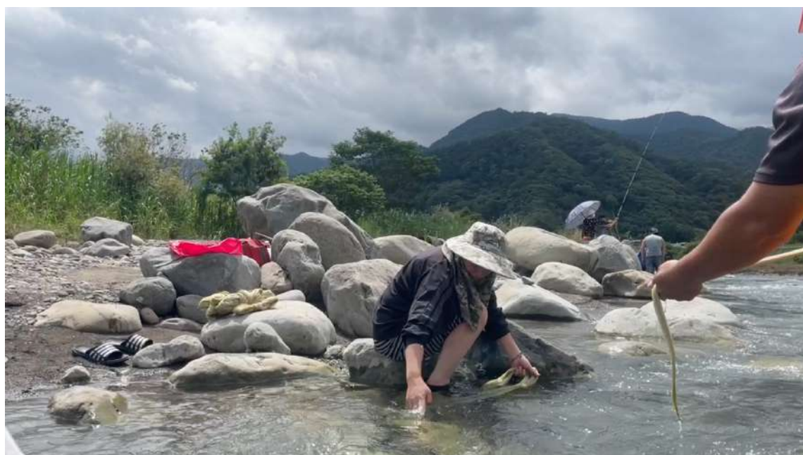
中港溪河畔洗滌苧麻纖維