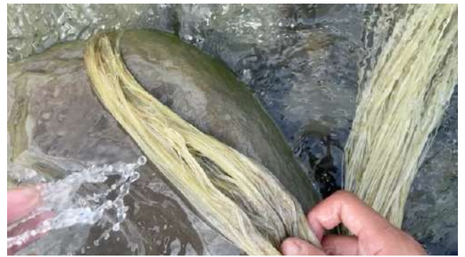
持續來回搓洗，讓纖維乾乾淨淨