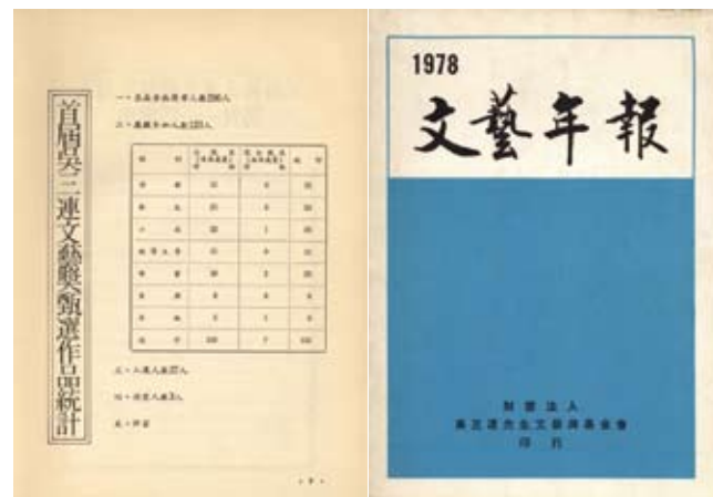
1978《文藝年報》創刊號，首屆吳三連文藝獎甄選，來函索取簡章人數二百九十六人，應徵參加人數一百二十三人。首屆文學類甄選作品包含詩歌三十一件、散文二十四件、小說二十三件、報導文學十一件。