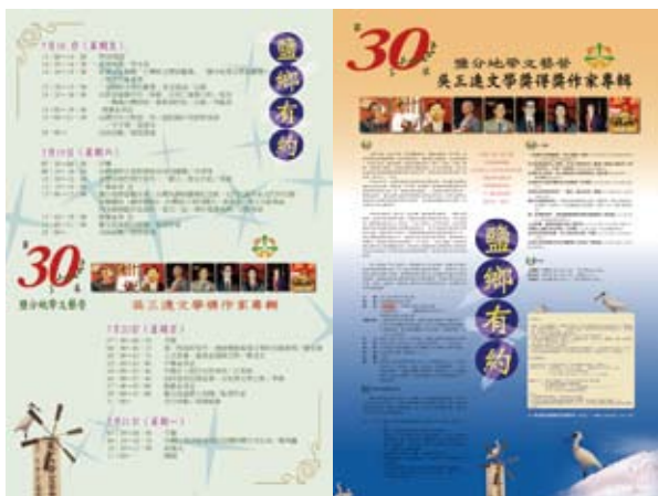
2008年是「鹽分地帶文藝營」的第三十屆，也是最後一屆。講師包含李喬、鄭清文、汪其楣、劉克襄、白萩、宋澤萊、楊青矗、吳晟等八位吳三連文學獎得主。