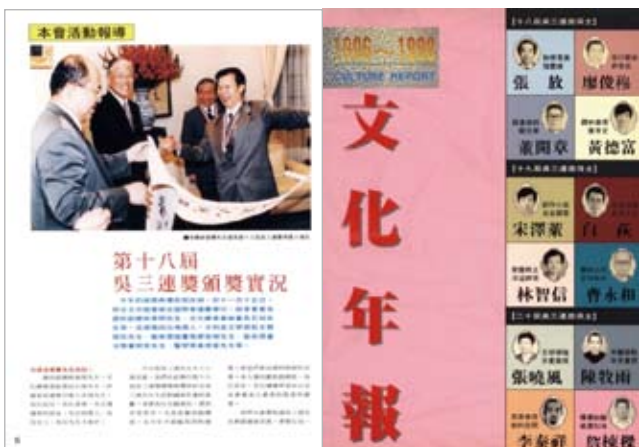
1998年最後一期《文化年報》設有「本會活動報導」、「文化觀察與文化評論」和「學術活動報導」三部分，包含出版現象、女性作家、漫畫發展等討論，以及「當代台灣都市文學研討會」與「馬關條約百年研討會」側記等文章。