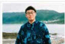
李羿璋 Lee Yi-Chang

2021 SKM 新光三越攝影巡迴聯展 2020 義大利FOTO Cuit攝影雜誌 2020 EPSON Silver & World Top15 2020 Paris PX3 bronze 2019 Bifa bronze