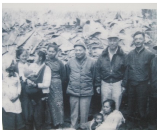
圖2. 民國 49 年 12 月 21 日至 25 日蔣經國前往南昆前線視察慰問官兵與家眷