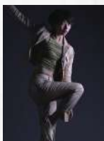
蕭涵方 #INFP小蝴蝶#人類圖反映者#喜歡真誠