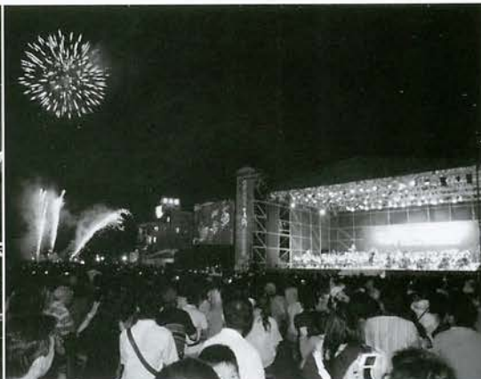
台灣大哥大日月潭花火音樂會“響焰雙十”

將交響樂結合煙火共同聯演，讓觀眾享受視覺與聽覺同步感受。現場湧入2萬多名觀眾為日月潭國家風景區帶來史無前例的熱鬧景象。