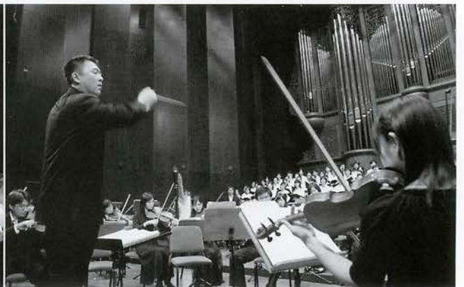
每年年終演奏貝多芬第九號交響曲，是樂興之時為台灣建立與世界祈福傳統同步的隆重心意，迄今已堅持七年累積無數感動的掌聲。