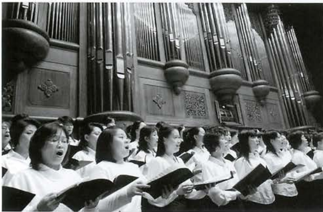
2007年終祈福音樂會樂興女聲暨節慶合唱團-貝多芬第九號交響曲