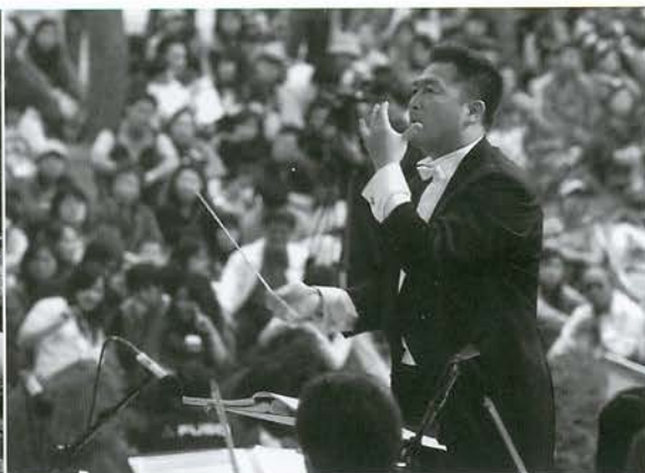
太魯閣台灣大哥大音樂節“如果·愛”

長達三小時的演奏，結合在地團隊與國內優秀音樂家，將原住民音樂交響化也重組古典精髓，他團無法複製的創意、熱誠與專業，讓現場一萬多名觀眾自動起立致敬！